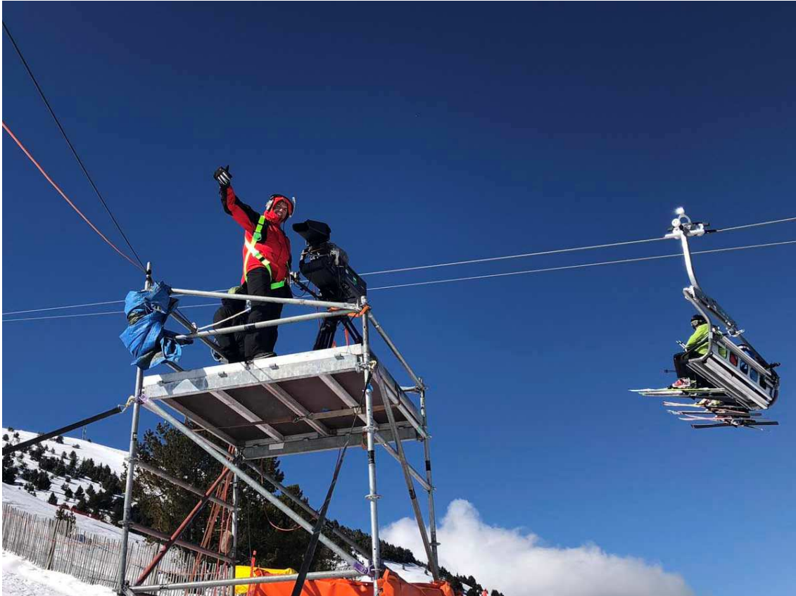
Equip de càmeres per a la retransmissió d'una carrera d'snowboard cros a La Molina.

La fi de la candidatura per als Jocs Olímpics d'hivern 2030 , enterrada el 21 de juny de l'any passat pel Comitè Olímpic Espanyol (COE), ha portat els responsables polítics a passar pàgina i buscar alternatives a aquest projecte. Des de les diverses comarques pirinenques continuen lluitant i treballant per millorar les comunicacions i infraestructures sense la necessitat d'un projecte olímpic. També en atraure altres esdeveniments esportius, com ara els Mundials de Piragüisme de La Seu i Sort del 2027 , sense renunciar a una futura candidatura. La Plataforma Stop JJOO no veu viable el turisme associat a l'esquí amb l'actual context d'emergència climàtica i demana alternatives que apostin per feines ben pagades i de qualitat pels joves.