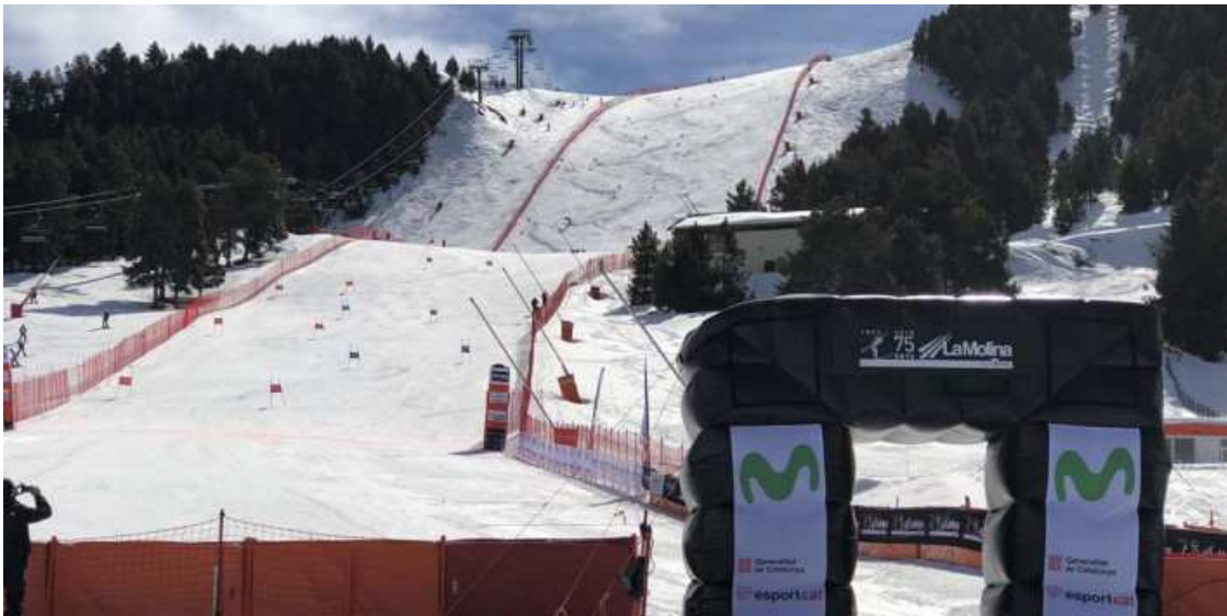
Els Jocs d'hivern continuen en el rerefons per a molts dels candidats del 28-M

Resignació, poca convicció o oportunitat perduda, algunes de les valoracions dels candidats en diversos municipis pirinencs