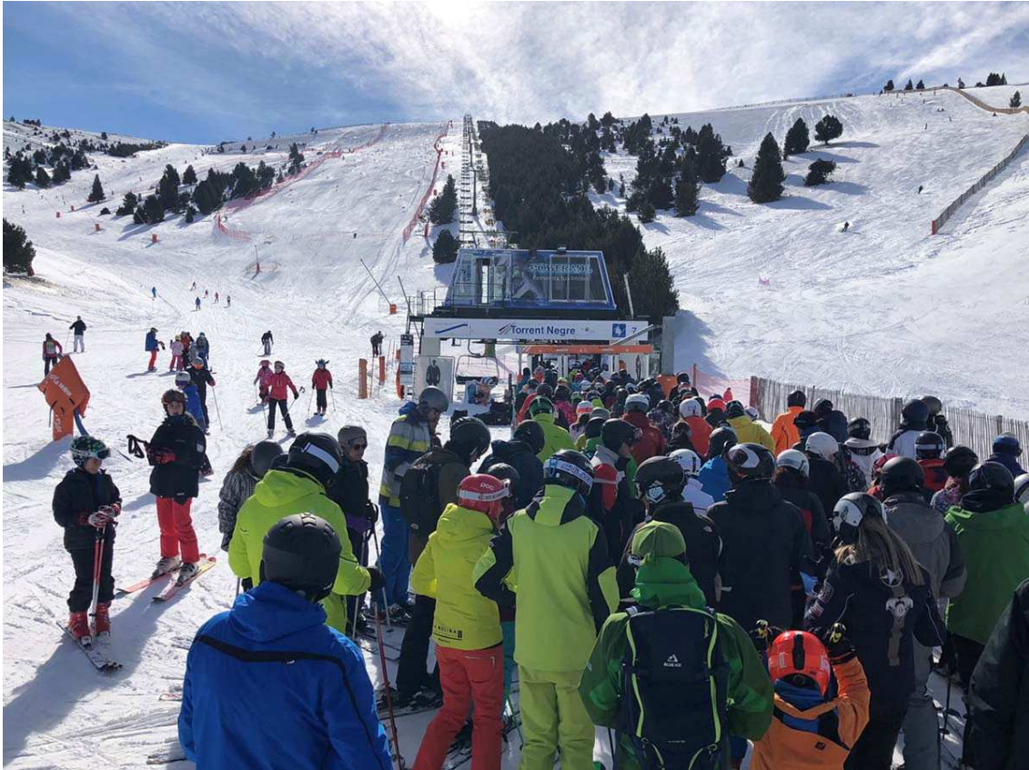
5 • Un dia de mitjans de febrer amb una alta afluència d'esquiadors al telecadira.