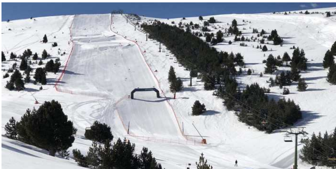
Trenta anys del telecadira Torrent Negre

Selecció de 10 imatges que recorden la seva història