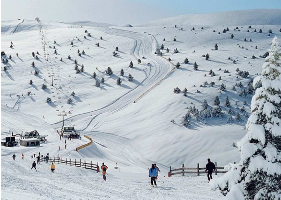
3 • Sector de Torrent Negre a mitjans dels anys 90.