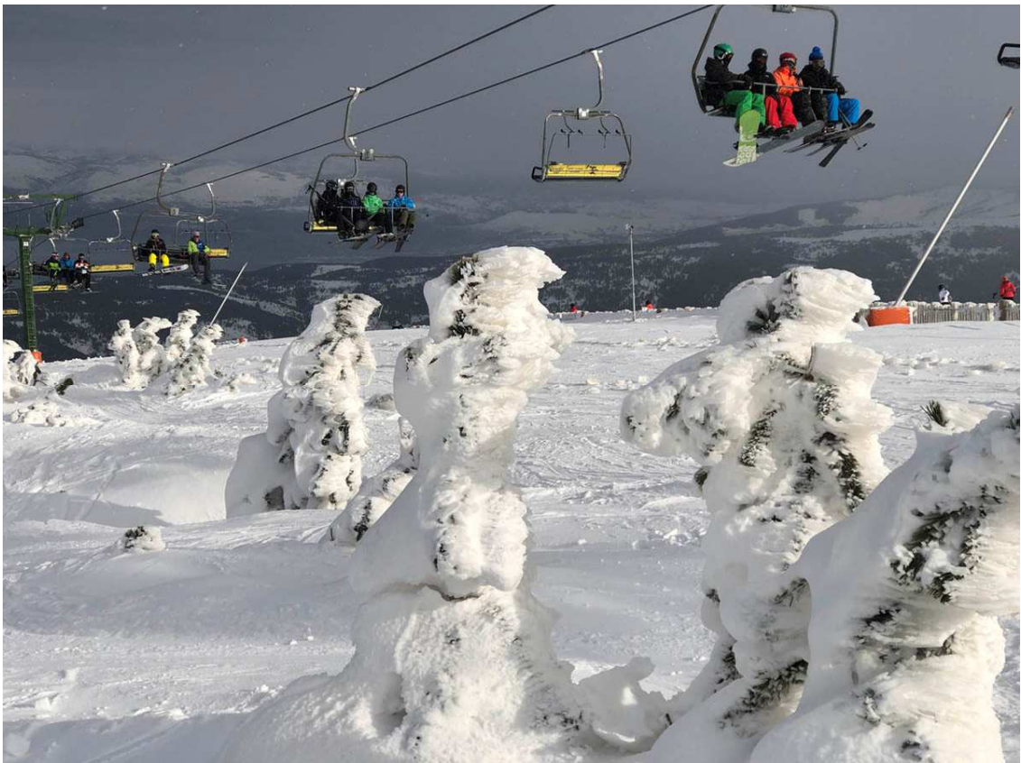
6 • Imatge del 26 de gener de 2020, després de la visita de la borrasca "Glòria".