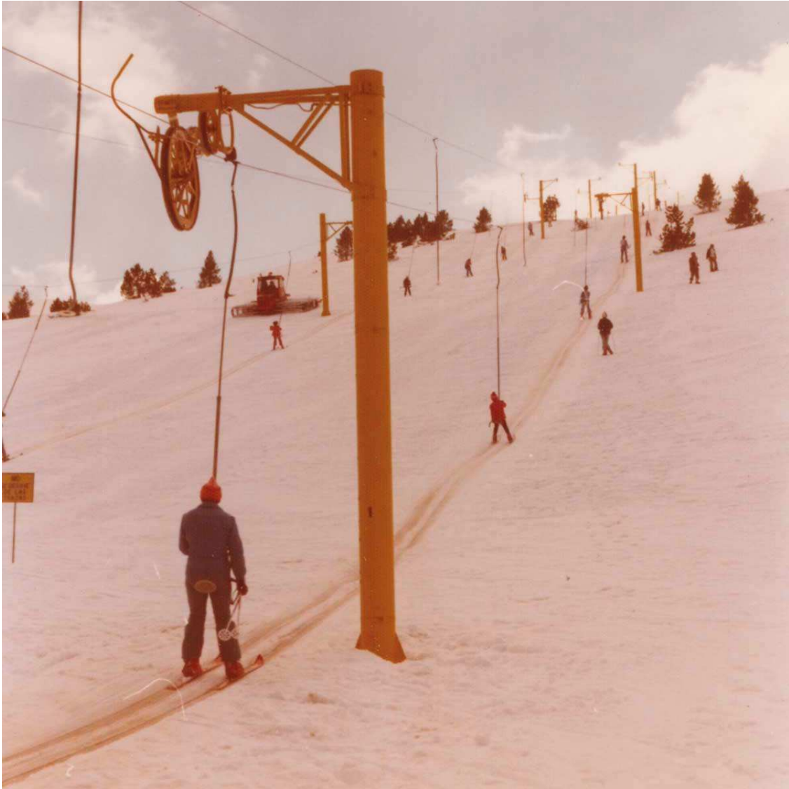
2 • Els dos teleesquís de Torrent Negre a ple rendiment (Foto: arxiu Ivan Giner).

El Telecadira de Torrent Negre és dels remuntadors amb més capacitat de transport i a la vegada demanda en el seu ús. El perquè és fàcil d'entendre: d'una banda permet accedir a una de les zones altes del domini, on sempre s'hi troba la millor neu per tractar-se d'una àrea encarada a nord i, per l'altra, per trobar-se tot el sector per damunt dels 2.000 metres.