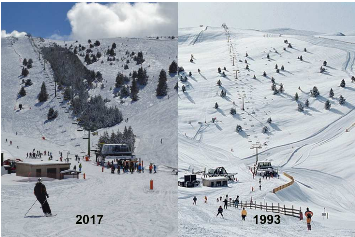
4 • Una fotocomposició publicada pel Diaridelaneu per mostrar el creixement del bosc de Torrent Negre.