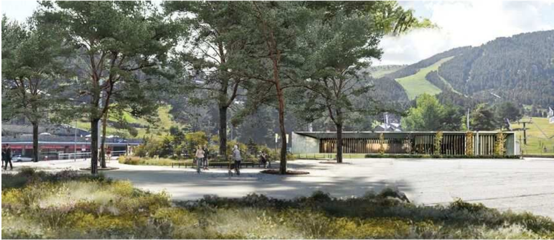
El aparcamiento de Pista Llarga se convertirá en una plaza peatonal libre de coches