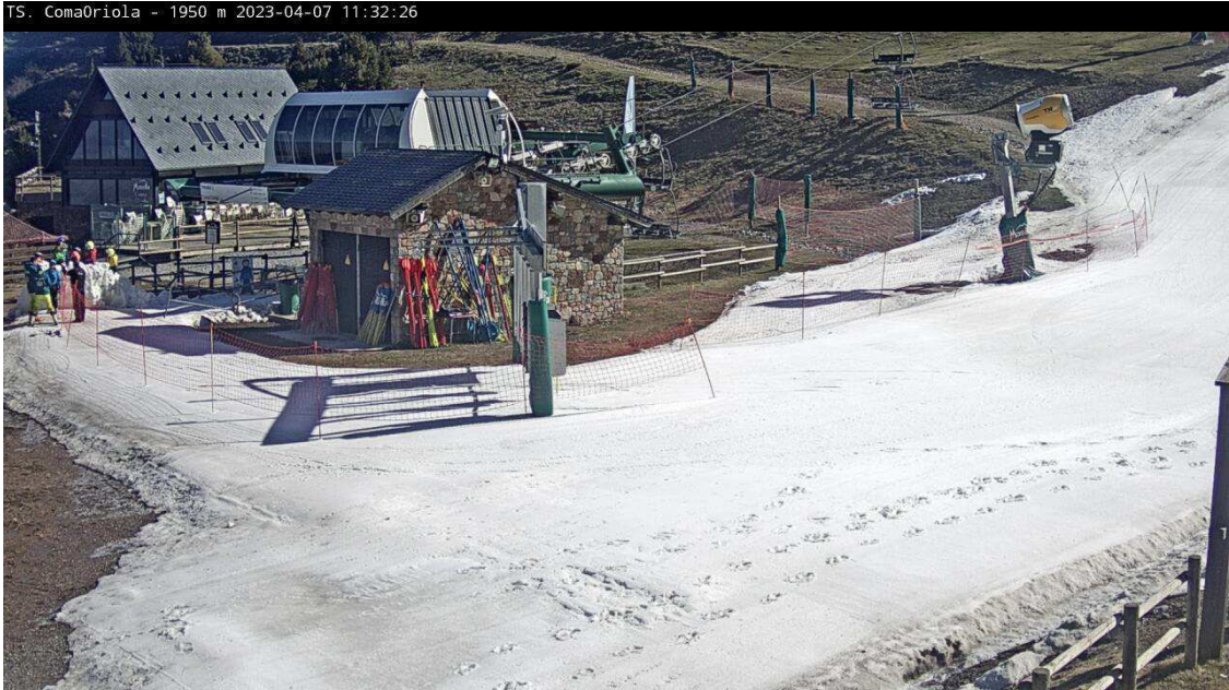
Telesilla de Coma Oriola. Imagen webcam viernes 7 de abril.

La falta de nevadas de este invierno sumado a un mes de marzo muy cálido ha podido más que las ganas de continuar que siempre tiene la estación de la Cerdanya. De esta forma se suma a La Molina, Baqueira, Boí Taüll o Port Ainé en el cierre programado para el último día festivo en Catalunya de las vacaciones de Semana Santa, el lunes 10 de abril.