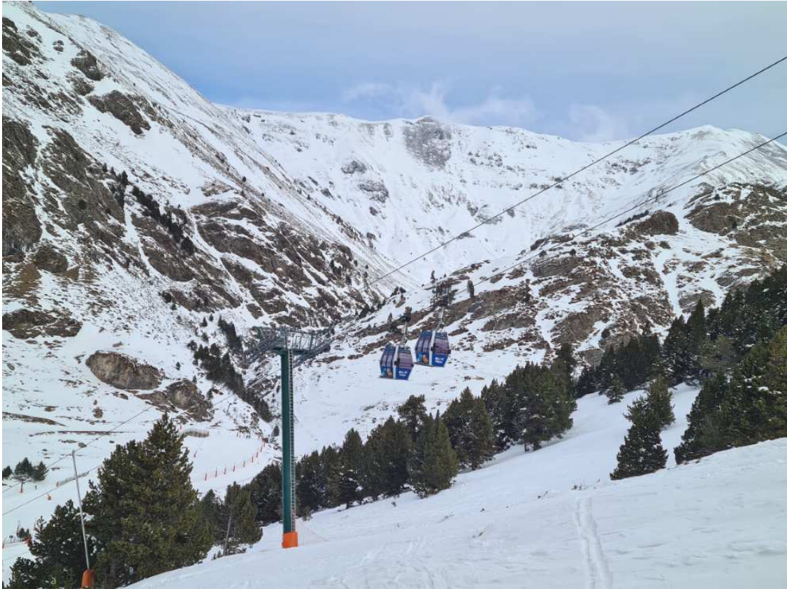
Vall de Núria. 2 de marzo de 2023.