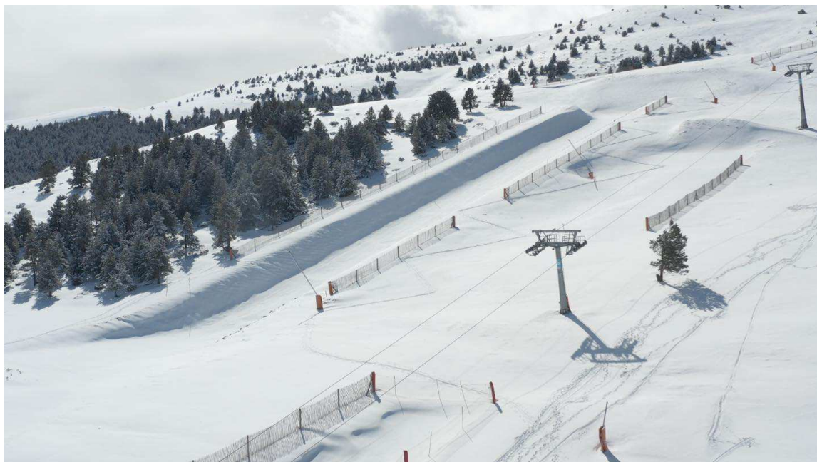
La Molina el 28 de febrero de 2023

Molina+Masella ), ha acogido hasta 55.800 visitantes, un 9,9% menos que la temporada anterior.