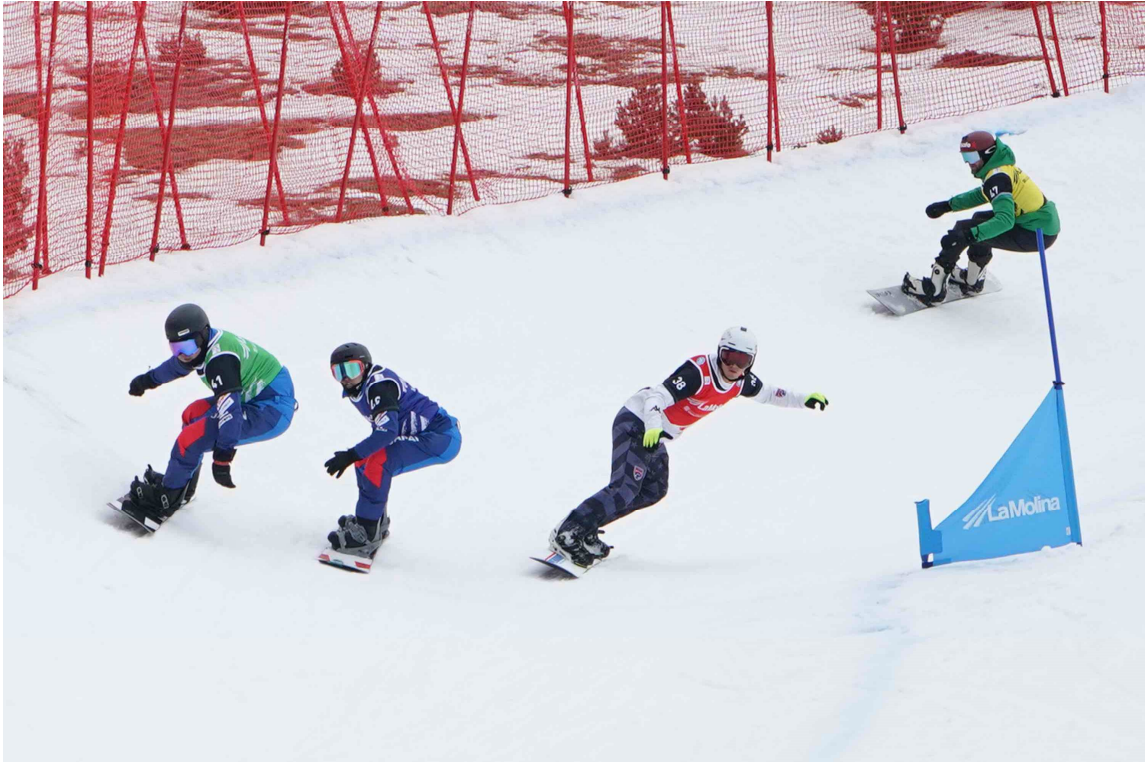
La Molina los mundiales FIS Para Snowboard 2023, el Snowboard Cross o SBX.

También cabe destacar que este año Vallter y La Molina han sido dos finales de etapa de la Volta Ciclista a Cataluña 2023. Un año más, dos estaciones de FGC han sido protagonistas de este espectáculo deportivo de alta montaña.