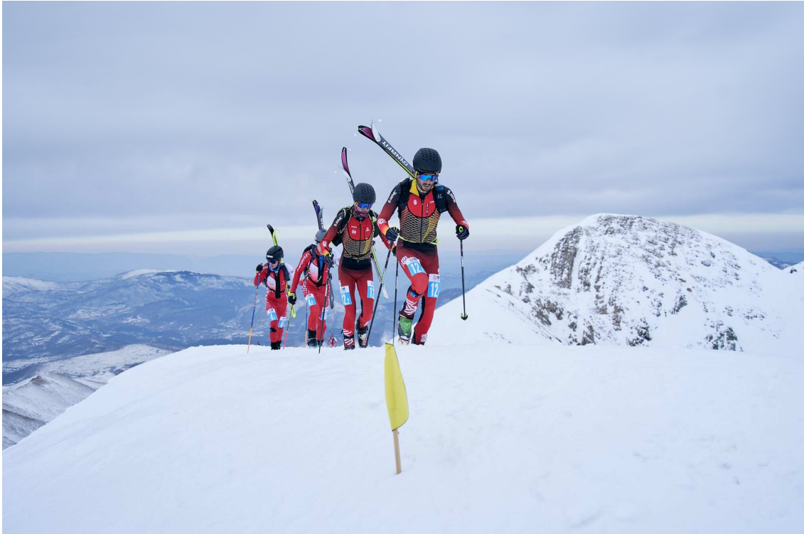
Boí Taüll Skimo. Prueba por equipos.

Además, la estación de Boí Taüll , del 27 de febrero al 5 de marzo, ha sido la sede de los ISMF World Championships Skimo 2023 . Como novedad, se ha adoptado por primera vez el formato olímpico, dado que el esquí de montaña se convertirá en deporte olímpico en los Juegos de Milán-Cortina 2026. Se disputaron cinco pruebas: esprint, individual, vertical, relevos y equipos, y participaron unos 400 esquiadores, de 24 equipos.