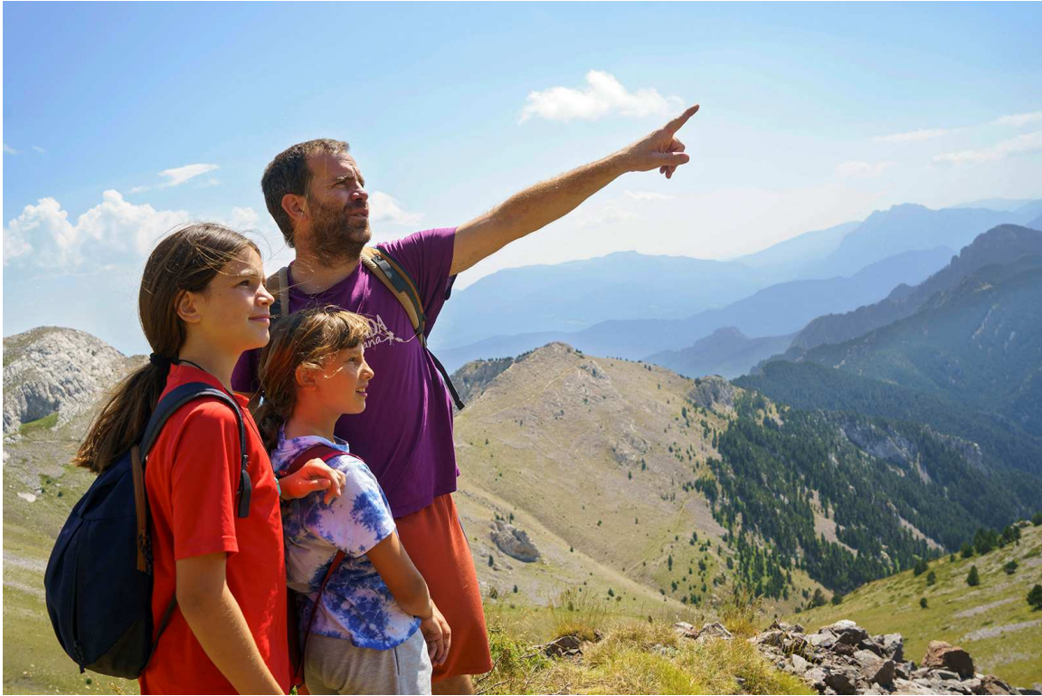
La Molina.

Las seis estaciones de montaña de Ferrocarrils darán por finalizada la temporada de esquí 2022–2023 este lunes día 10 con la vista puesta en el verano.