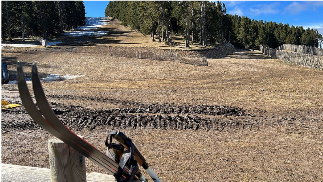
Una estació d'esquí nòrdic del Pirineu sense neu

A l'Alt Pirineu el gruix de neu és el més baix en tres dècades mentre que al Ripollès i la Cerdanya ja no en queda