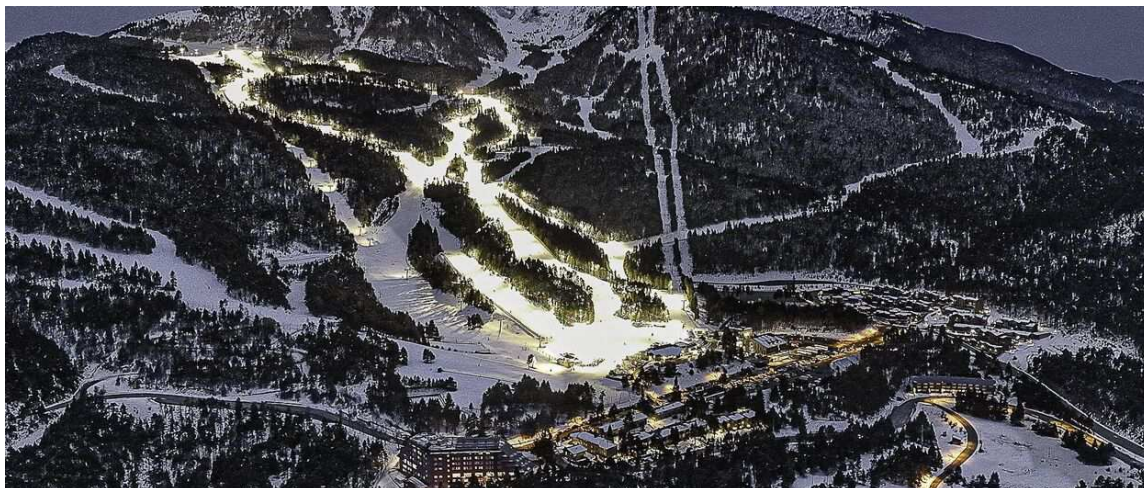
Imagen aérea del esquí nocturno de Masella

Como cada año por estas fechas y coincidiendo con el alargamiento de las horas de luz y a tres semanas del cambio de hora que aún hará más largas las jornadas, Masella da por concluida la temporada de esquí nocturno.