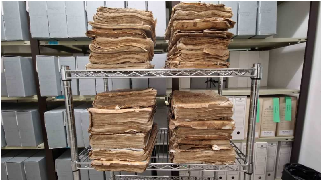
Llibres notariais preparats per a la digitalització.

Concretament, el fons Notarial de Puigcerdà, conté protocols de Puigcerdà, pobles de Cerdanya, la Vall de Ribes, Ripoll i Camprodon. “Constitueix un patrimoni documental de primer ordre i és el fons més consultat del nostre arxiu”, han apuntat des de l’equipament, tot afegint que la riquesa en informació que aporten els protocols fa que siguin utilitzats per a recerques de tot tipus, i molt especialment per les recerques genealògiques. De fet, recentment s’han treballat aquests llibres en investigacions sobre comerç de llana i teixits, fargues i comerç de ferro, retaules i producció pictòrica, bandolerisme, estructures familiars, aprofitaments forestals, etc.