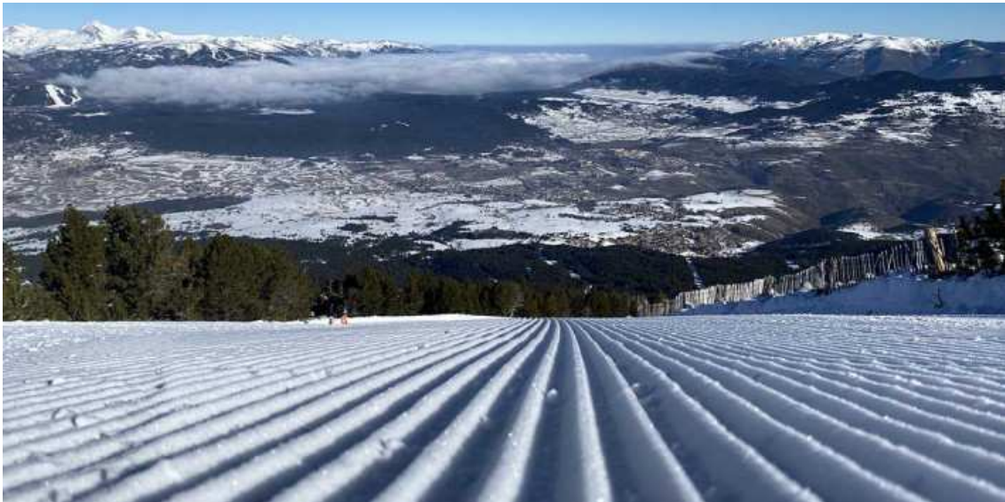
Dies de neu pols a Cambre d'Aze

L'estació torna a la normalitat de les "no vacances" a partir d'aquest dilluns