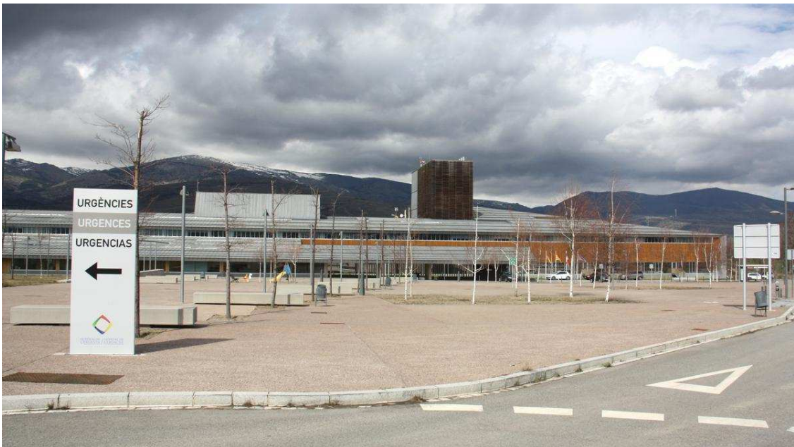
L'exterior de l'hospital de la Cerdanya. RG7

Professionals de l'hospital de Sant Pau atendran a l'hospital comarcal. La mesura de Salut també s'estendrà a la resta dels Pirineus