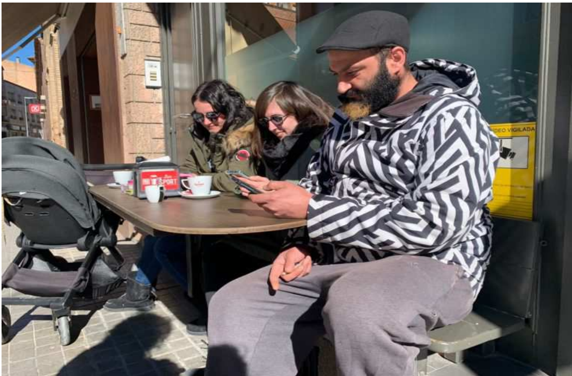
Veïns de la Pobla de Segur rebent el missatge de Protecció Civil.

Algunes persones han trucat al 112 perquè no saben que es feia el simulacre