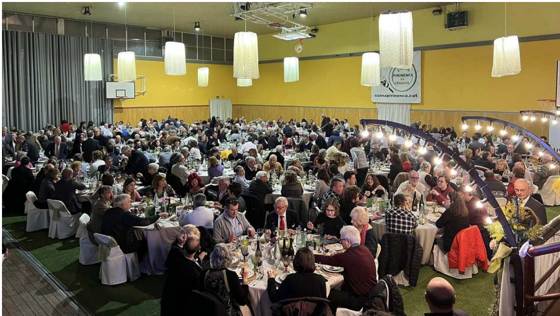
photo_camera La Festa del Trinxat de Puigcerdà ha esdevingut una trobada multitudinària al cor de l'hivern

El sopar, que va començar a les nou del vespre, va comptar amb la presència de personalitats rellevants de la vida cultural, social i política.