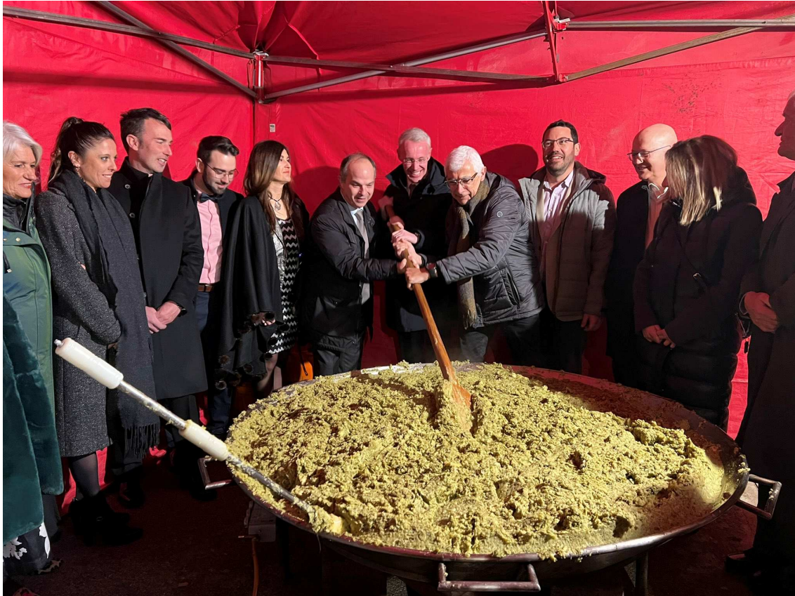
La Festa del Trinxat de Puigcerdà ha esdevingut una trobada multitudinària al cor de l'hivern

La Festa del Trinxat és la principal mostra gastronòmica de la comarca i una cita obligada pels amants de la cuina cerdana, alhora que ha esdevingut una trobada multitudinària al cor de l'hivern, amb un sopar de gala que serveix d'aparador de la gastronomia local i dels productes Km0 com són la col d'hivern o les trumfes, ingredients que són facilitats per l'ajuntament de Puigcerdà als restaurants col·laboradors de Puigcerdà que són els encarregats de la elaboració del trinxat.