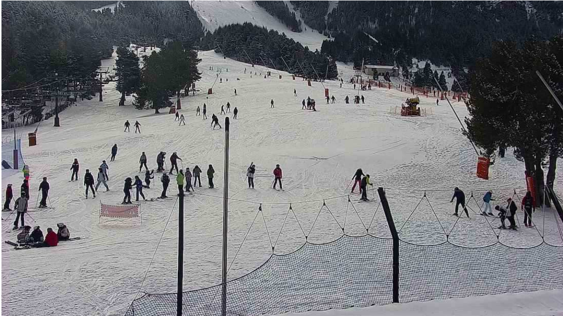
Webcam Pista Llarga de La Molina.

En la Molina ha caído una media de 10 cm, con un máximo de 15 en la cima de La Tosa (2.535 metros), más o menos lo mismo que en la vecina Masella .