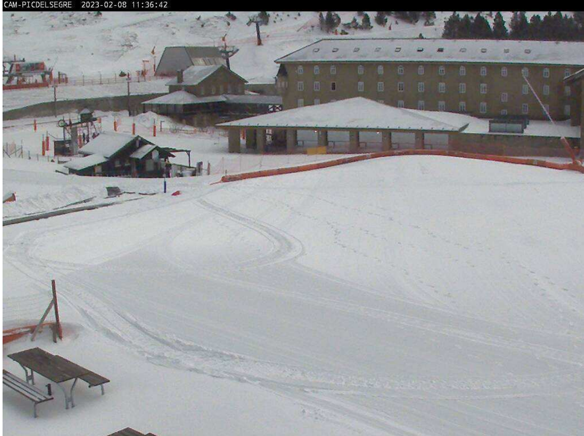
Webcam Santuario de Núria.

Las máquinas están trabajando para intentar abrir más superficie esquiable este fin de semana, que dependerá en parte de lo que se pueda producir de nieve.