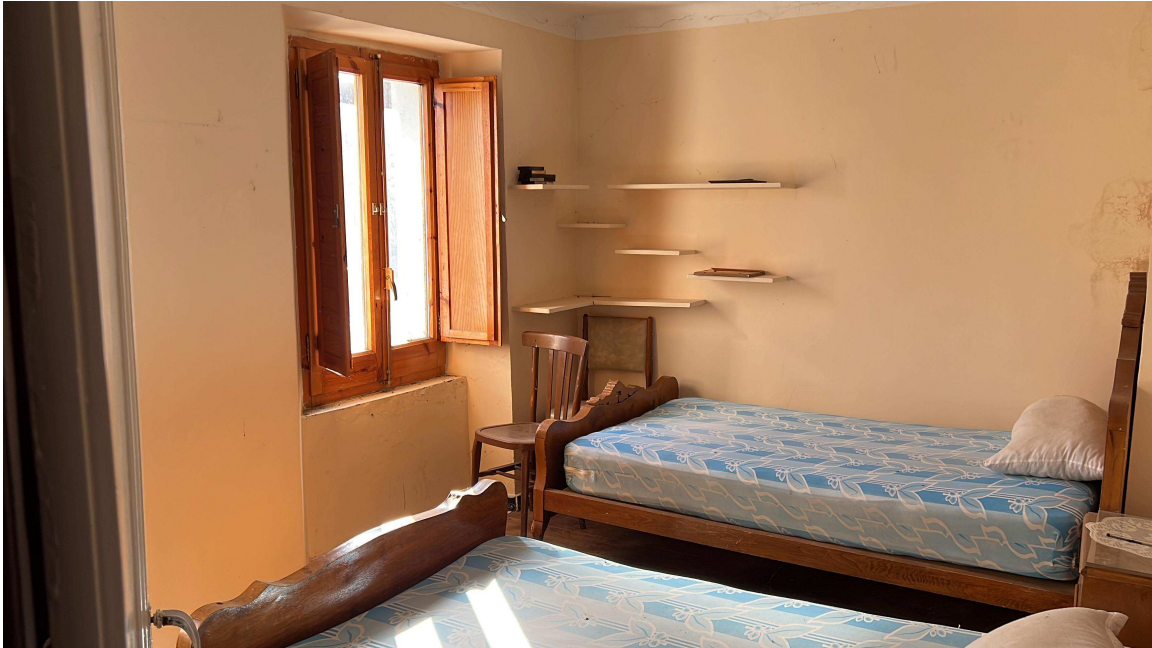
Una de les habitacions d'un pis que es rehabilitarà com a habitatge de protecció oficial

L'alcalde de Fontanals de Cerdanya, Ramon Chia, ha dit que l'objectiu del projecte és "donar ambient" als petits pobles, "on no hi ha cap mena de servei". En aquest sentit, ha detallat que tot i que al nucli de Queixans hi ha dos restaurants, els veïns ja no tenen cap lloc on veure's en el "dia a dia" i que ho troben a faltar.