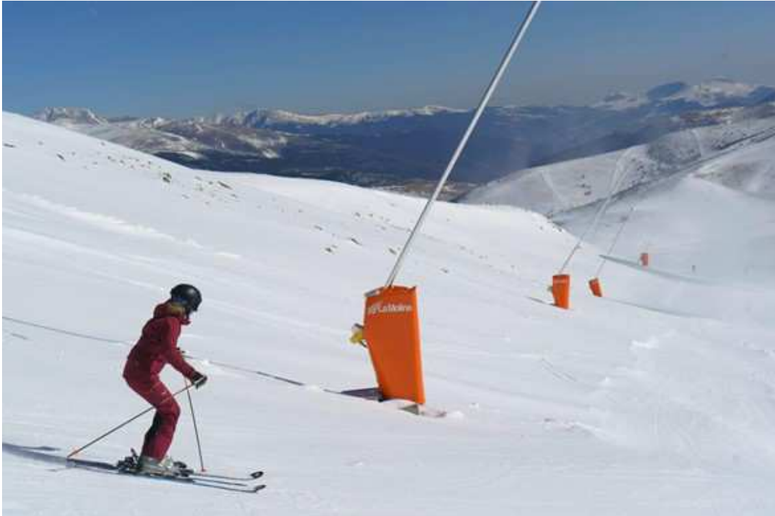
Pista Barcelona de l'estació de La Molina

La pista Barcelona també es va condicionar i adequar perquè sigui possible fer-hi curses internacionals de velocitat. Al mateix temps es va remodelar per fer-la més atractiva per al públic esquiador d'alt nivell. Pel que fa a la competició, el traçat està en procés d'homologació per part de la Federació Internacional d'Esquí (FIS) i, per tant, en molt poc temps serà el referent de l'esquí de velocitat als Pirineus.