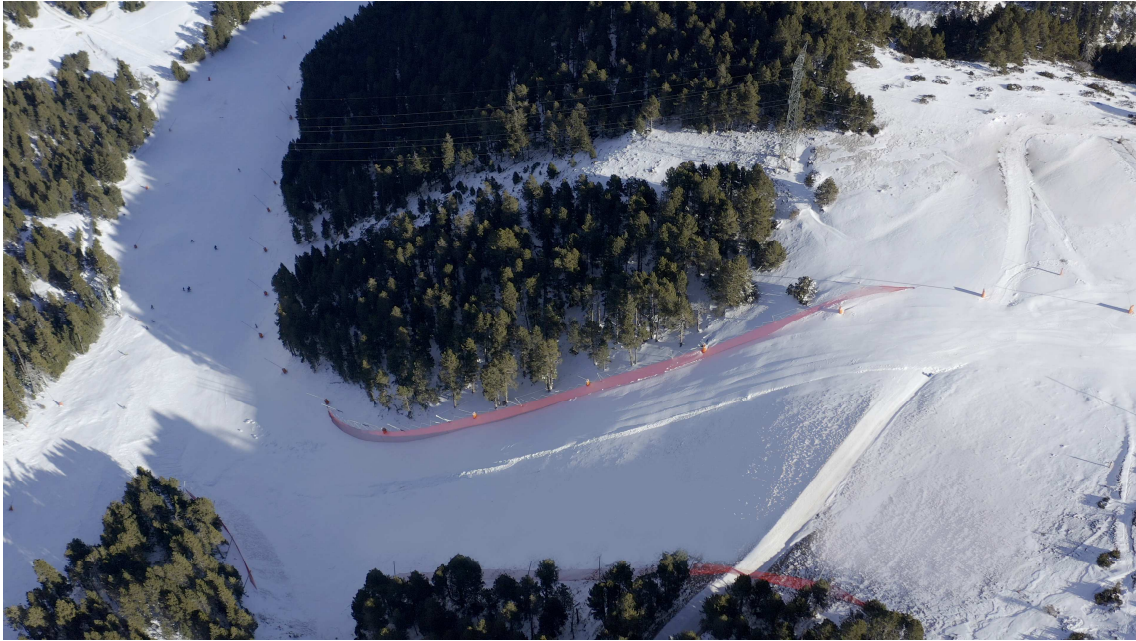
Pista Barcelona de l'estació de La Molina / FGC

A més, a la zona Trampolí també s'obrirà l'Slàlom Nissan e-POWER . En acabar el recorregut, les persones esquiadores poden veure el temps que han fet i descarregar el vídeo del descens a la web de La Molina. I ubicat a l'Snowpark de Trampolí també s'estrenarà el Big Air Bag perquè tots els riders puguin saltar i demostrar les seves habilitats.