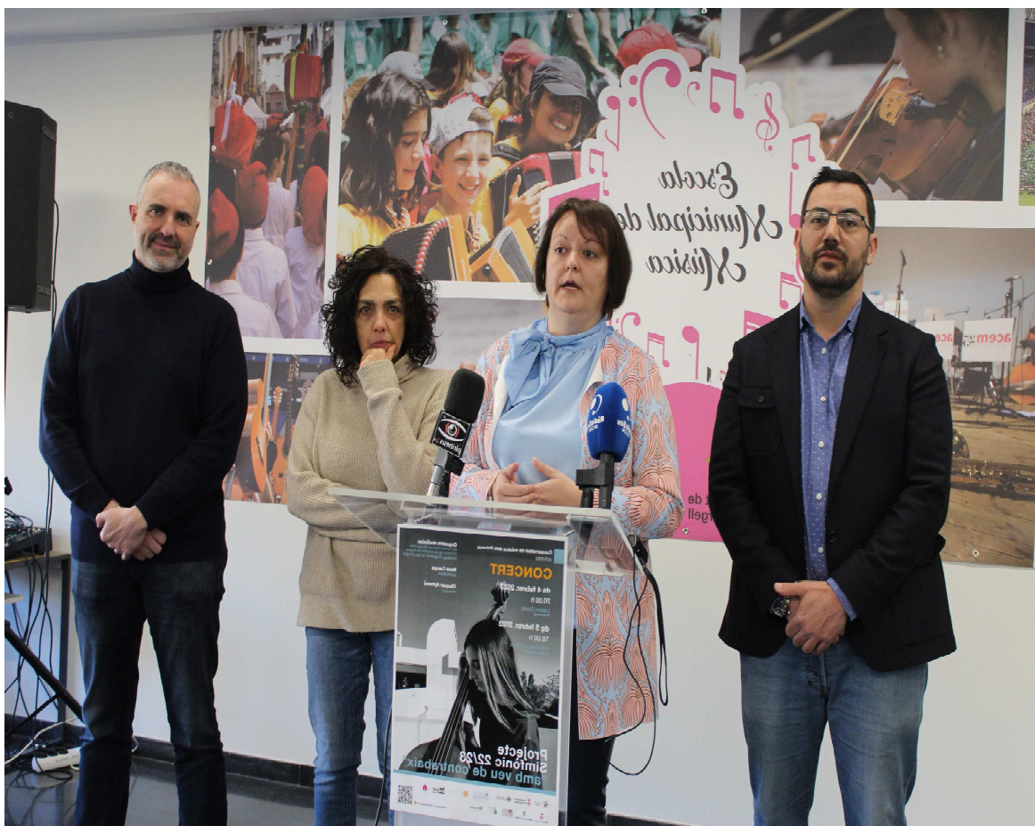
L'Escola Municipal de Música i el Conservatori de música dels Pirineus presenten la programació / laseu.cat

El Conservatori de música dels Pirineus presenta els concerts del Projecte Simfònic 2022-2023 a Puigcerdà i la Seu d'Urgell . Així, l'orquestra Simfònica del Conservatori oferirà “Amb veu de contrabaix” a Puigcerdà i la Seu d'Urgell aquest proper dissabte 4 de febrer a les vuit del vespre al Casino Ceretà de Puigcerdà i diumenge 5 de febrer a sis de la tarda a la sala Sant Domènec de la Seu d'Urgell.