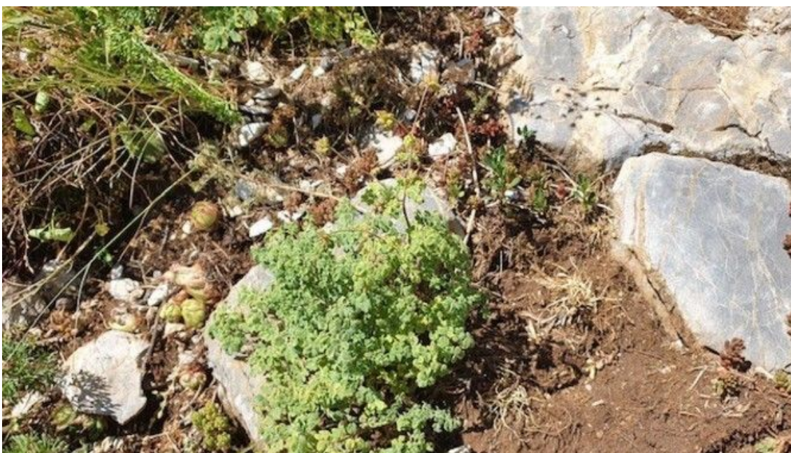
La " Thalictrum foetidum " s'incorpora al llistat català de plantes a protegir (Pere Aymerich)

"És una planta que viu en fissures de les roques, té una fulla petita i la seva flor no és espectacular. No destaca per la seva bellesa però sí pel fet que estem davant la població més occidental a nivell d'Europa i l'única població als Pirineus i a tota la Península ibèrica."