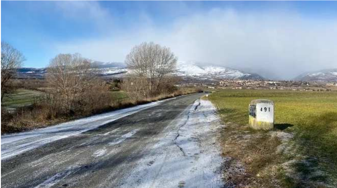
El Camí d'Age, a la Cerdanya, es va reobrir per una acció dels veïns / TV3

A la Cerdanya, el tancament dels passos fronterers secundaris s'ha viscut de manera molt negativa. La línia de la frontera és situada, d'una banda, enmig de camps de conreu o terrenys boscosos pertanyents als municipis de Guils, Puigcerdà i Alp, i, d'una altra banda, a les comunes de la Tor de Querol, Enveig, Ur, la Guingueta d'Ix (Bourg-Madame) i Palau de Cerdanya. Una colla de fites de granit n'assenyalen el traçat, però la relació entre els veïnats ha estat sempre necessària, complementària i productiva.