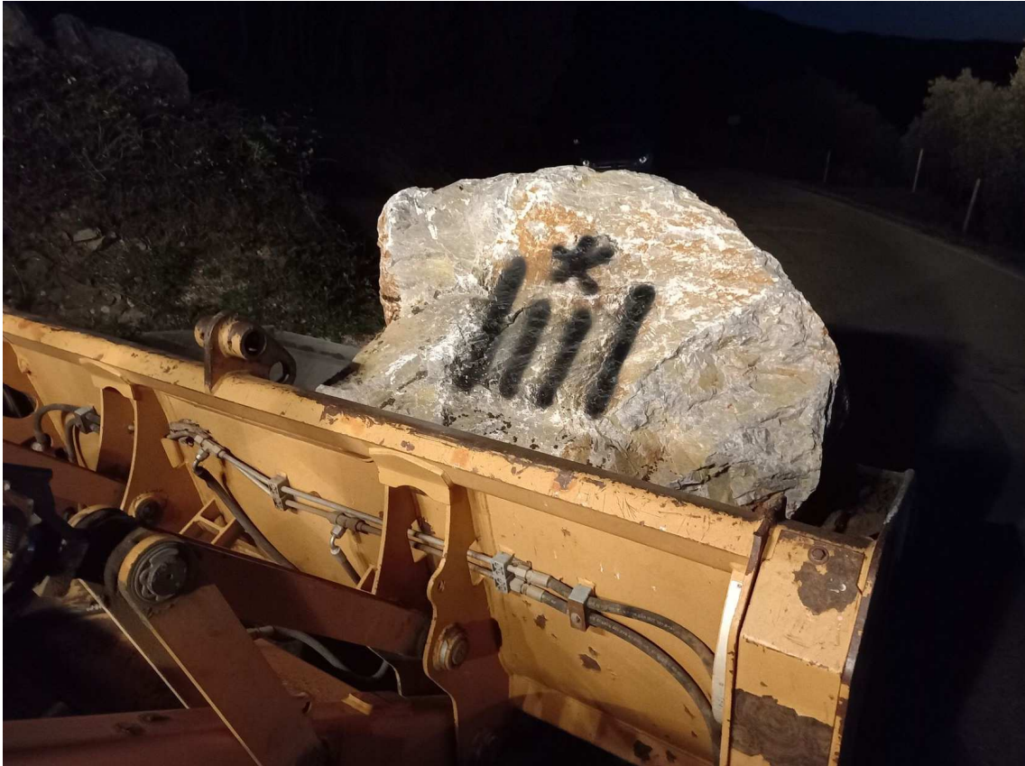
El Col·lectiu per l'Obertura dels Passos Fronterers ha retirat les pedres que barraven el pas a la Catalunya Nord amb una gran excavadora

El pas fronterer entre Espolla, a l'Alt Empordà, i Banyuls de la Marenda, al Rosselló, es va tancar l'11 de gener del 2021 amb una filera de rocs per ordre precisament de la dels Pirineus Orientals -- a representació del govern francès a la Catalunya del Nord. Els arguments de França, en plena pandèmia, era que volia "contenir la immigració irregular i l'amenaça terrorista".