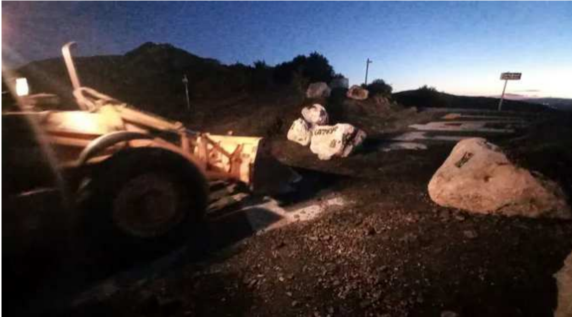
Els veïns han retirat les pedres que barraven el pas del Coll de Banyuls amb una gran excavadora

El Col·lectiu per l'Obertura dels Passos Fronterers ha retirat les pedres que barraven el pas a la Catalunya Nord amb una gran excavadora . Diuen que han pres la iniciativa per solucionar situacions injustes per veïns i treballadors d'un costat i l'altre de la frontera.