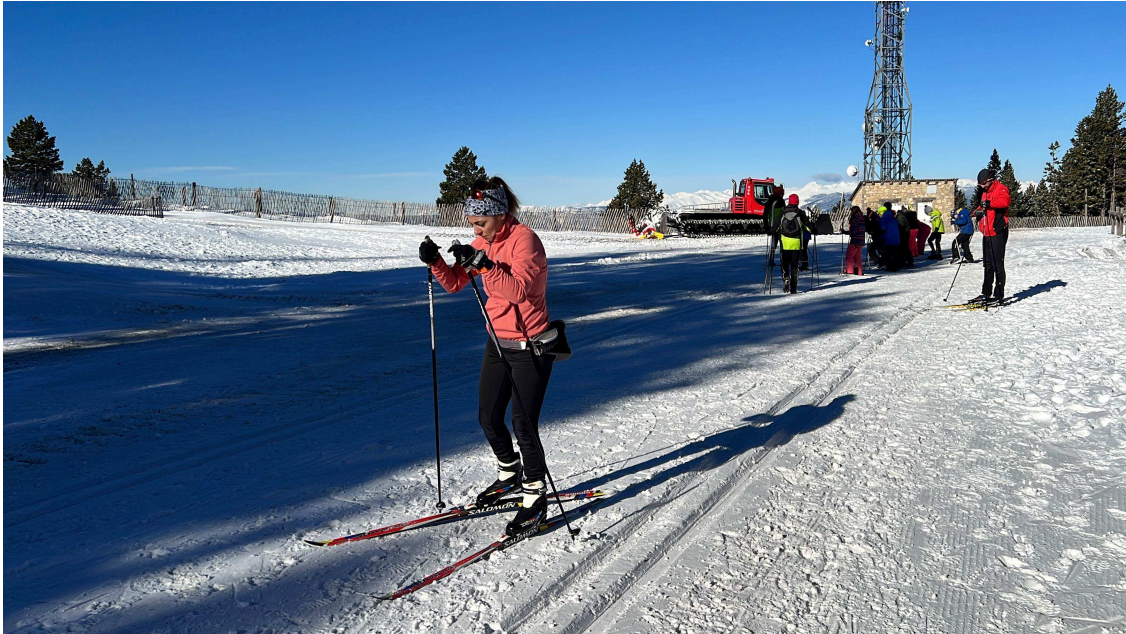
Una esquiadora de fons a l'estació de Tuixent-La Vansa