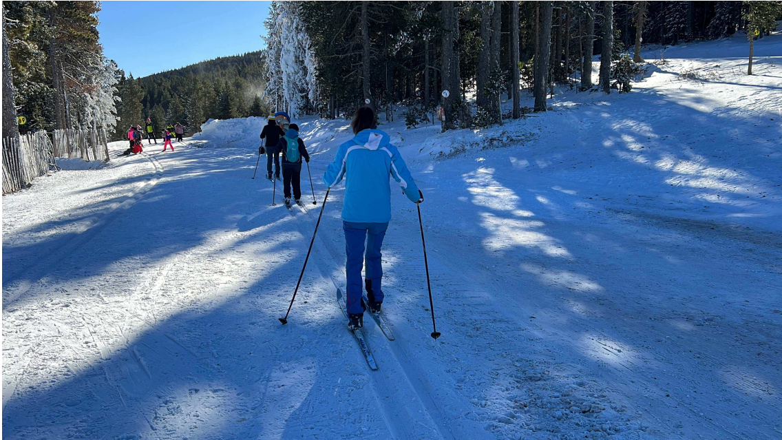
Un grup d'esquiadors de fons en un dels circuits de l'estació de Tuixent-La Vansa