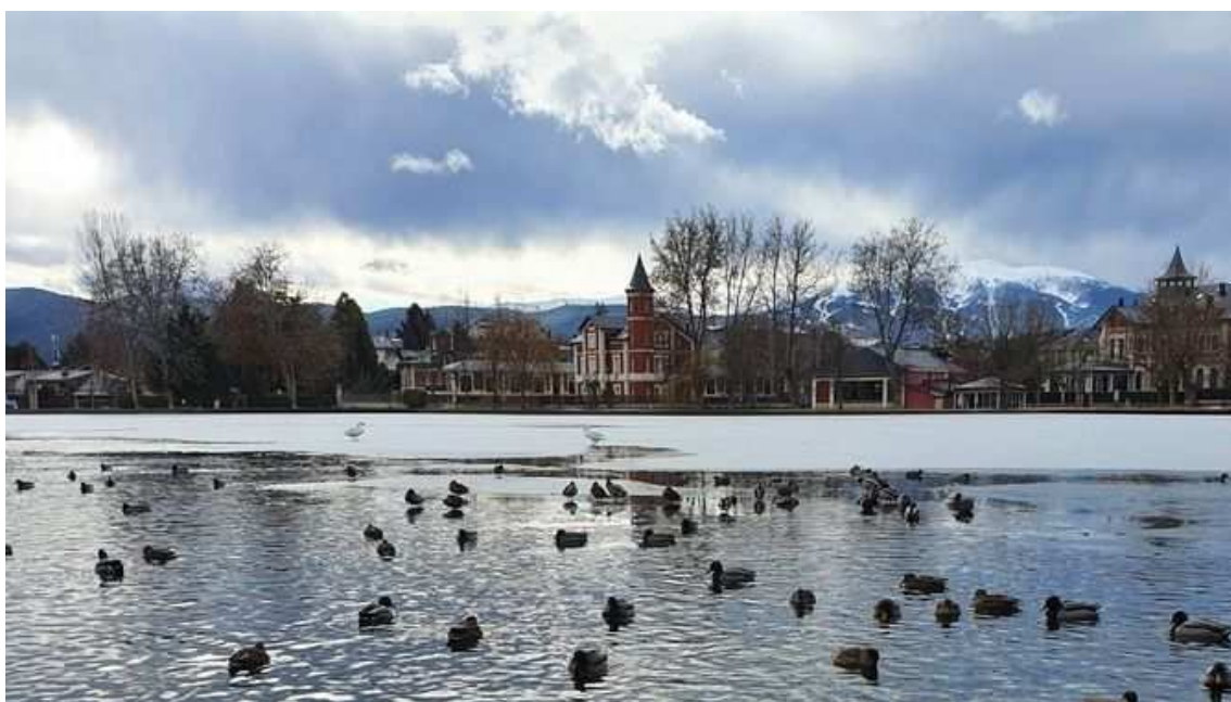
Estany de Puigcerdà mig glaçat (Daniel Caparrós)

Si bé durant bona part del dia el temps serà assolellat, les nevades arribaran a partir de la tarda de la mà d'una sistema frontal que ens travessarà durant la nit de dijous a divendres,, unes hores que seran les més fredes del dia i que afavoriran que nevi al nord del país i al prelitoral de Tarragona.