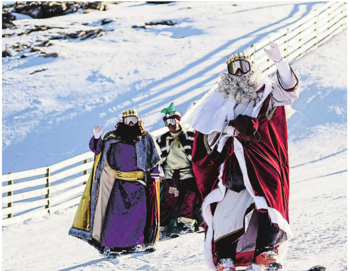
Los Reyes Magos descendieron por las pistas de la estación aragonesa de Aramón Cerler

Masella, con picos de 5.000 visitas en una sola jornada, es una de las que más ha sufrido la falta de nieve