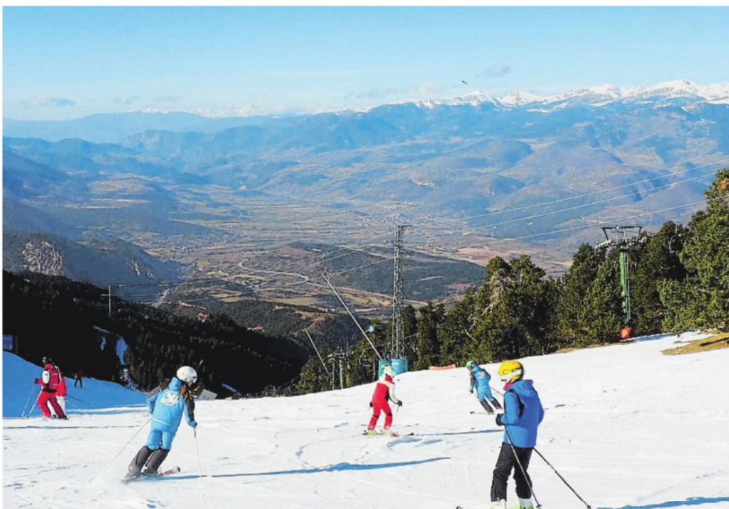
Masella, que ha sufrido mucho la falta de nieve, ha tenido picos de 5.000 visitantes en una sola jornada

La estación aranesa ha ofrecido a los clientes captados por su agencia de viajes para este fin de semana de Reyes modificar sus reservas y recortar los días de