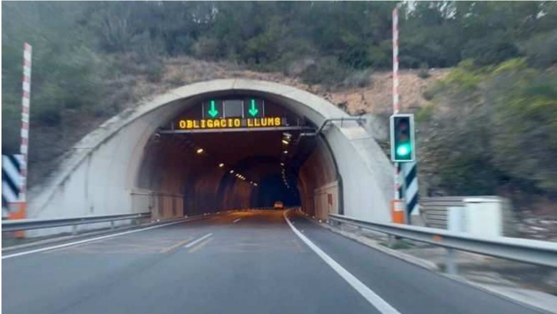
Els túnels del Cadí i els de Vallvidrera també s'han encarit aquest any

Com el tren que fa cent anys arribava per primer cop a la Cerdanya i encara triga tres hores des de Barcelona fins a Puigcerdà.