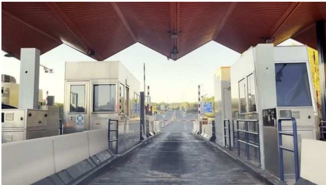
Peatge de Cunit, al Baix Penedès

"Estem parlant amb el govern de l'estat per poder fer possible aquesta vinyeta a Catalunya, perquè creiem que és el model que ens permetria aixecar aquestes barreres i que el pagament de les vies d'alta capacitat tingués un element de justícia territorial."