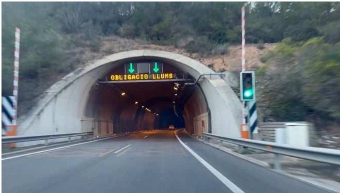
Els túnels del Cadí i els de Vallvidrera també s'han encarit aquest any

Com el tren que fa cent anys arribava per primer cop a la Cerdanya i encara triga tres hores des de Barcelona fins a Puigcerdà.