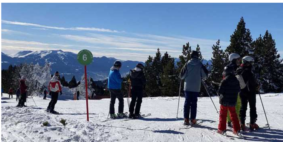
Un bon destí per viure una entrada d'any amb neu a pistes i après-ski a partir de les 5 de la tarda

Ens trobem a ben pocs dies de Cap d'Any i les estacions d'esquí de la Catalunya del Nord ens informen de l'estat de pistes i de les activitats après-ski. A més, cal tenir present que en aquest hivern, en el qual el fred i la neu es fan pregar com mai, la garantia ja hi és posada gràcies al bon gruix de neu que les estacions han pogut produir sobre els traçats des d'inicis del mes de desembre. Les estacions no estan obertes al 100%, ben cert, però les condicions per a l'esquí són òptimes.