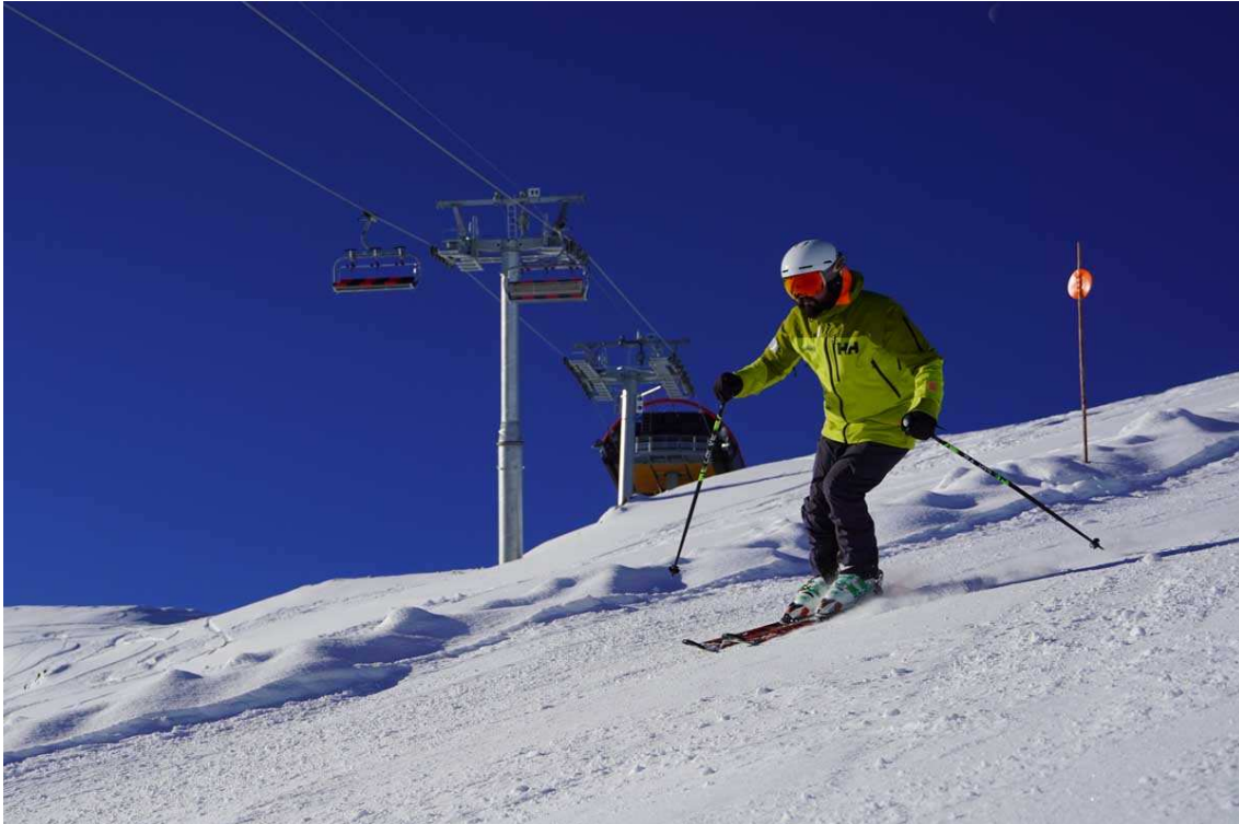
El nou telecadira de Porté Puymorens ja és obert al públic.