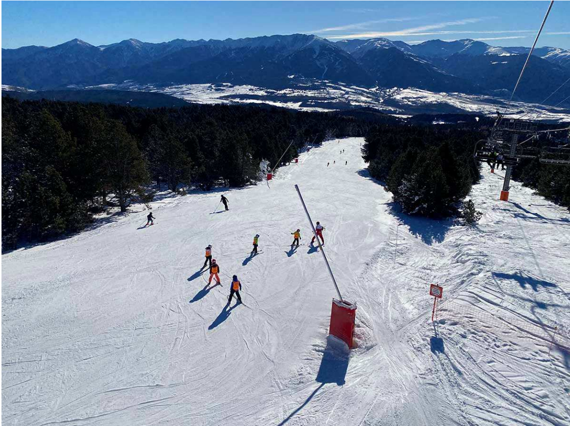
Professor d'esquí amb alumnes a Font Romeu Pirineus 2000 durant les passades festes de la Puríssima 2022 (Foto: DDLN).