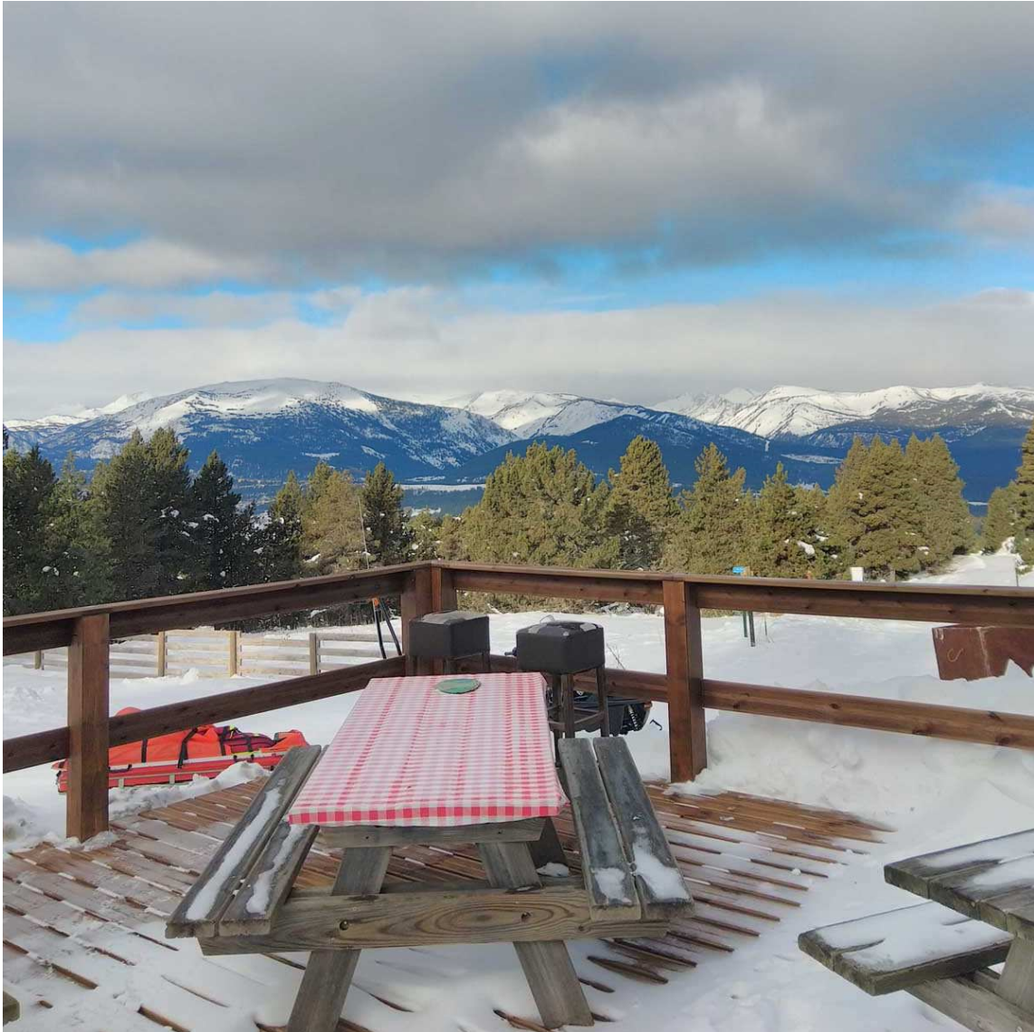
Terrassa i panoràmiques des del Refugi Coll del Torn. L'Estació de Nòrdic del Capcir es prepara per al seu 40 aniversari.