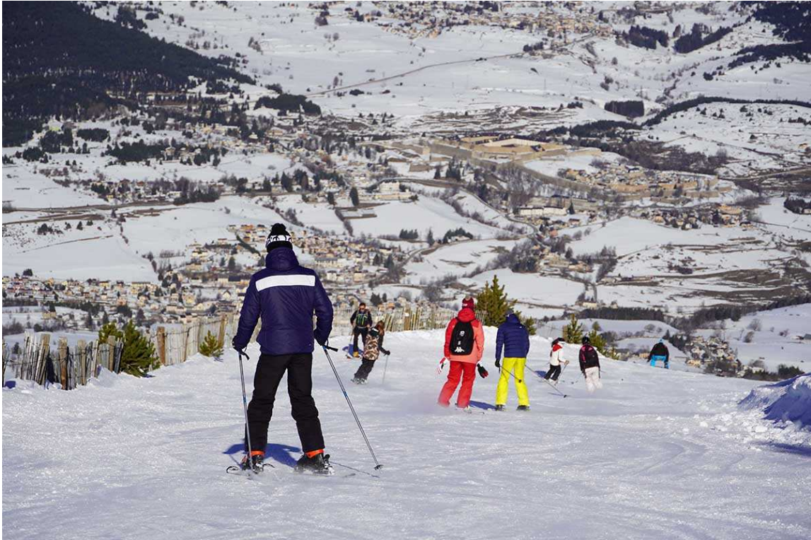
Cambre d'Aze en una imatge de la temporada passada.