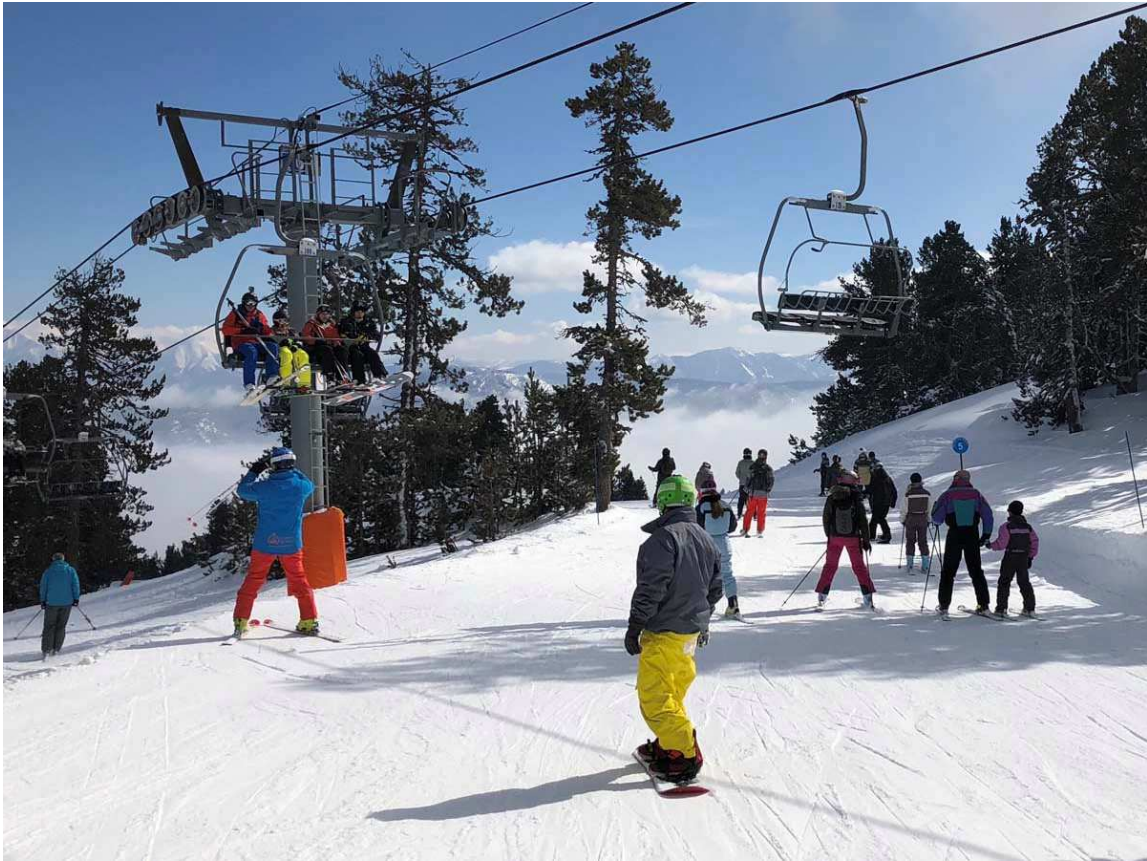
Pista La Panoramique i telecadira La Calmazeille de Formiguères en una imatge d'arxiu.

www.facebook.com/fontromeu.pyrenees2000/