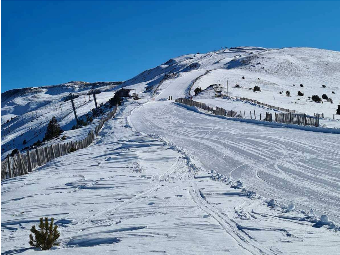
Puigmal 2900 en una imatge de la passada temporada.