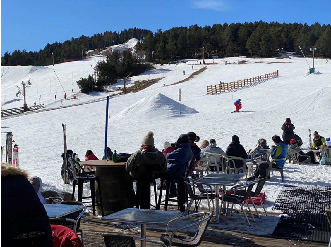
La Quillane, petita en espai, gran en activitats