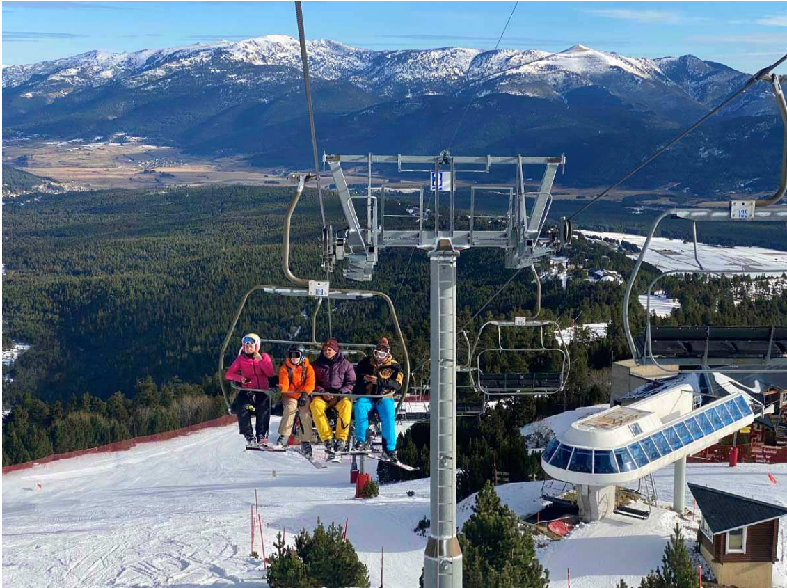
Telecadira Les Jassettes de Les Angles durant la passada Puríssima 2022 (Foto: DDLN).