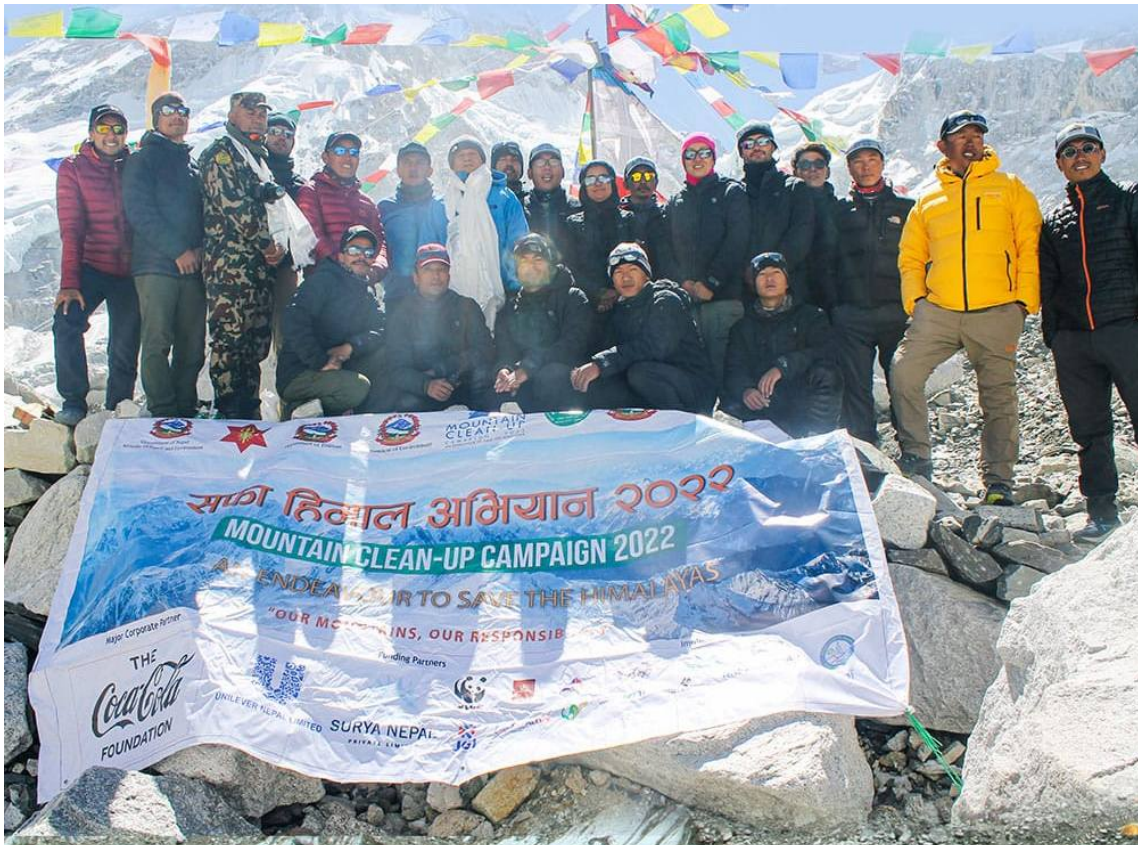
Campaña Mountain Clean-up 2022 en los ochomiles de Nepal.