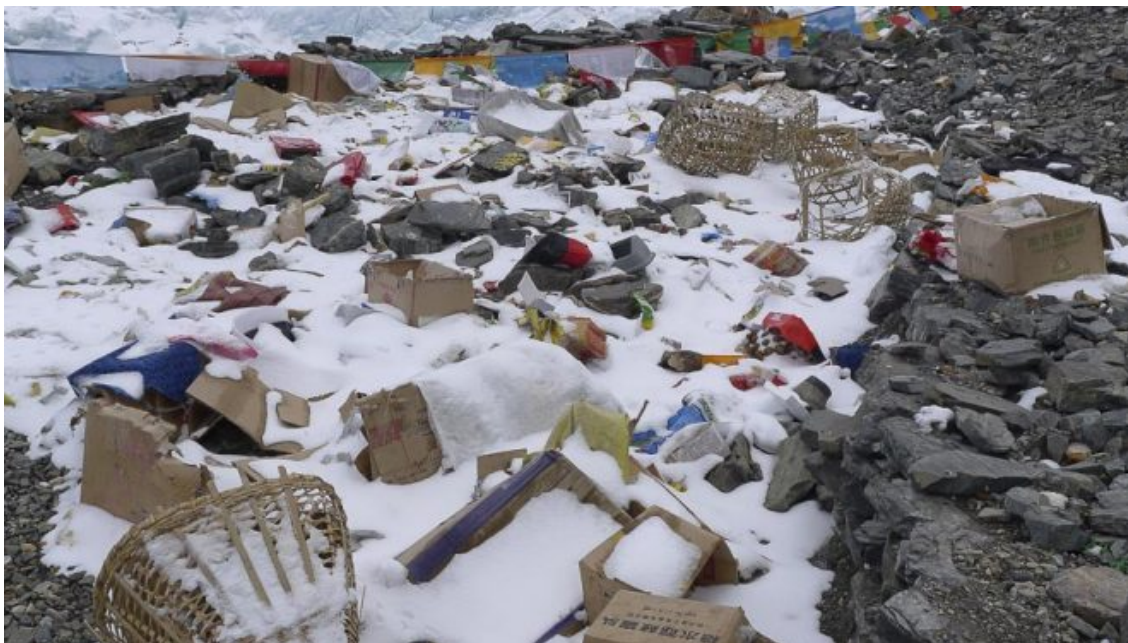
Basura abandonada en el campo base del Everest (vertiente norte).