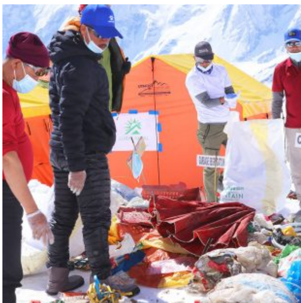
Campaña Mountain Clean-up 2022 en los ochomiles de Nepal (Foto: Mountain Clean-Up Campaign).

Según el IUCN World Heritage , el departamento dedicado al patrimonio mundial de la Unión Internacional para la Conservación de la Naturaleza, entre los años 2014 y 2016 el nivel de visitas anuales promedio a la región del Everest fue de 30.000 personas , mientras que entre 2018 y 2019 la cifra ascendió a 57.000 , es decir que el turismo casi se duplicó en sólo tres años .