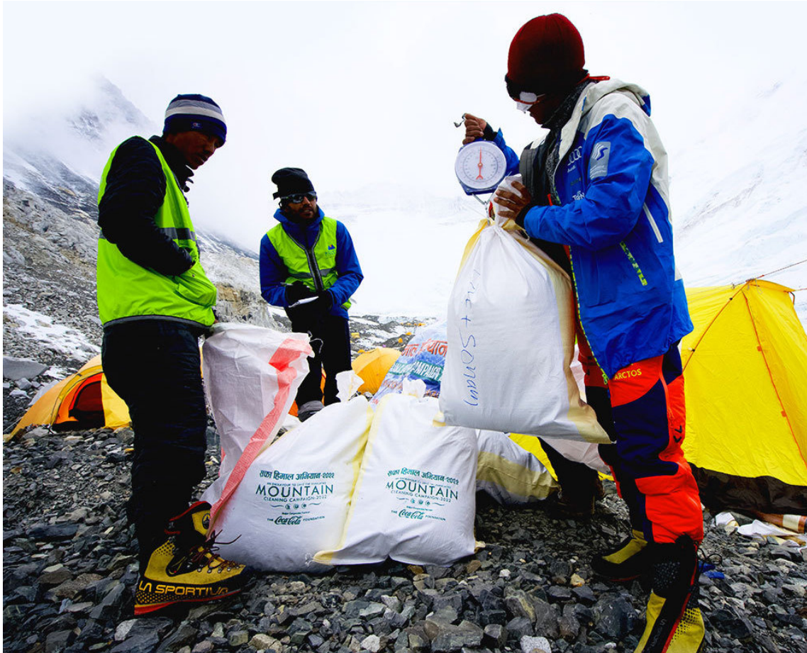
Campaña Mountain Clean-up 2022 en los ochomiles de Nepal (Foto: Mountain Clean-Up Campaign).