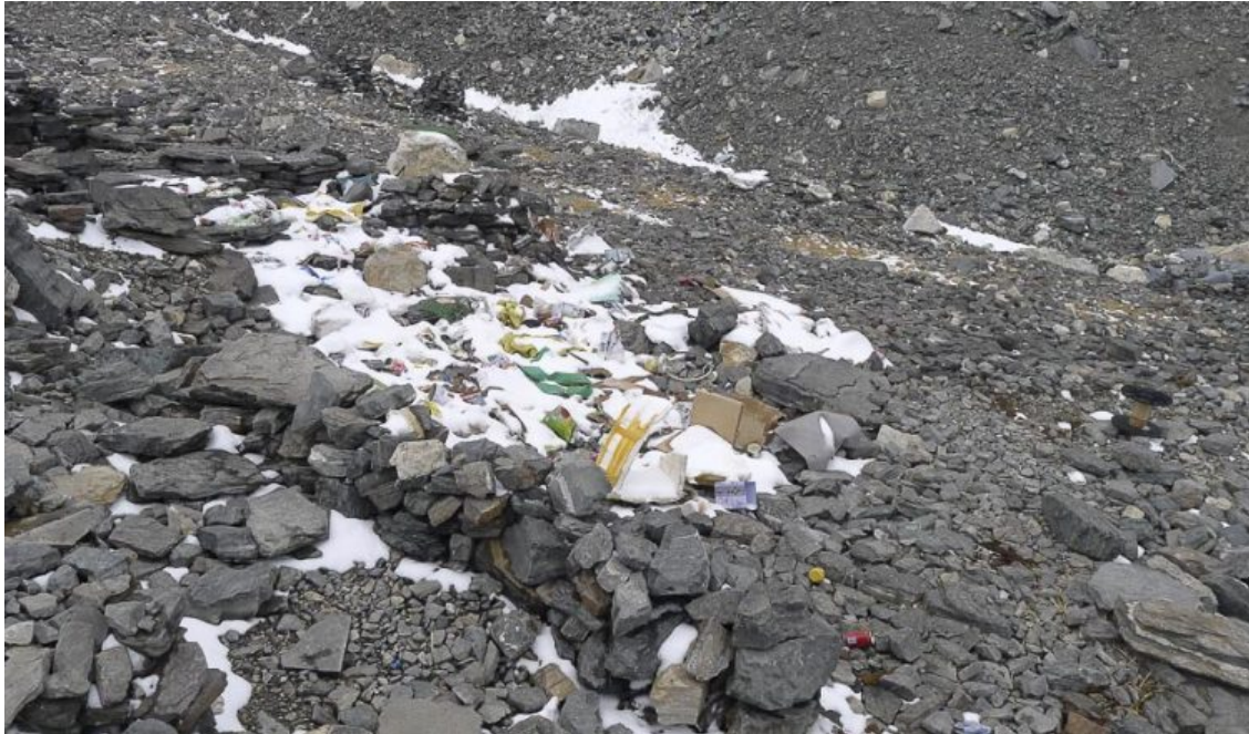
Basura abandonada en el campo base del Everest (vertiente norte)