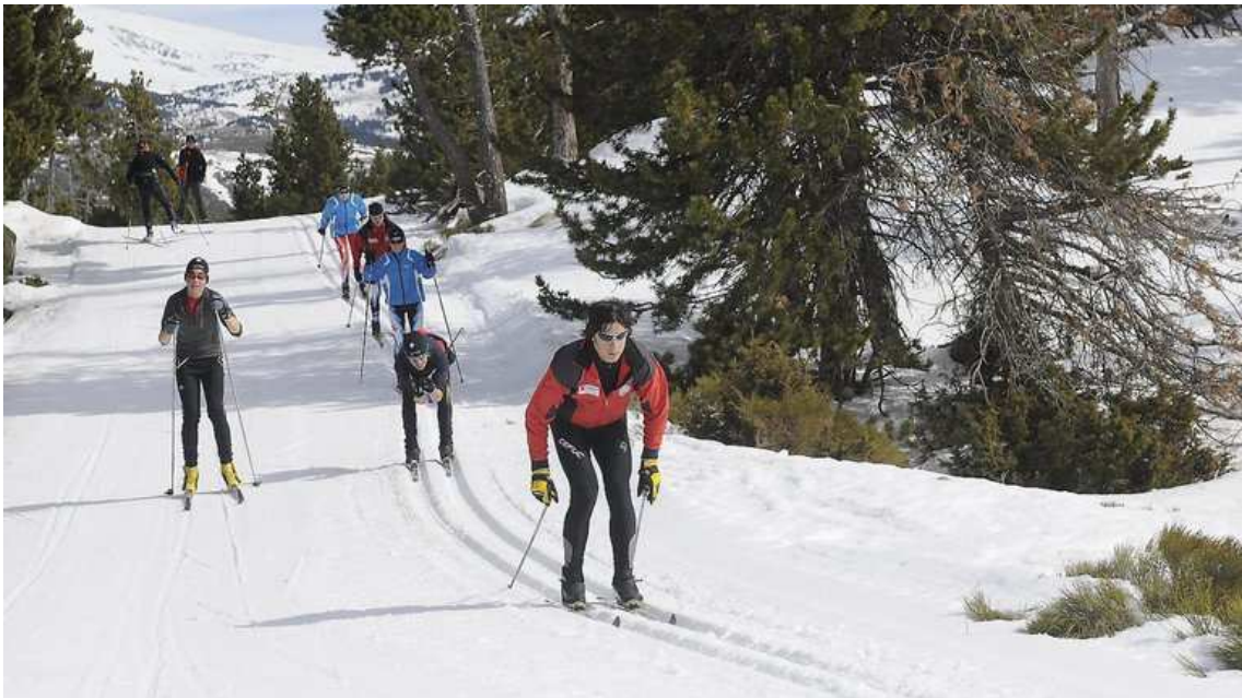
El Pla de sostenibilitat turística de les destinacions d'esquí nòrdic de Catalunya rebrà fons europeus / TotNòrdic

Les entitats beneficiades són la Mancomunitat de municipis per a la promoció de les estacions d'esquí nòrdic; el Consell Comarcal del Pallars Sobirà; l'Ajuntament de Lladorre i l'Ajuntament de la Pobla de Segur.