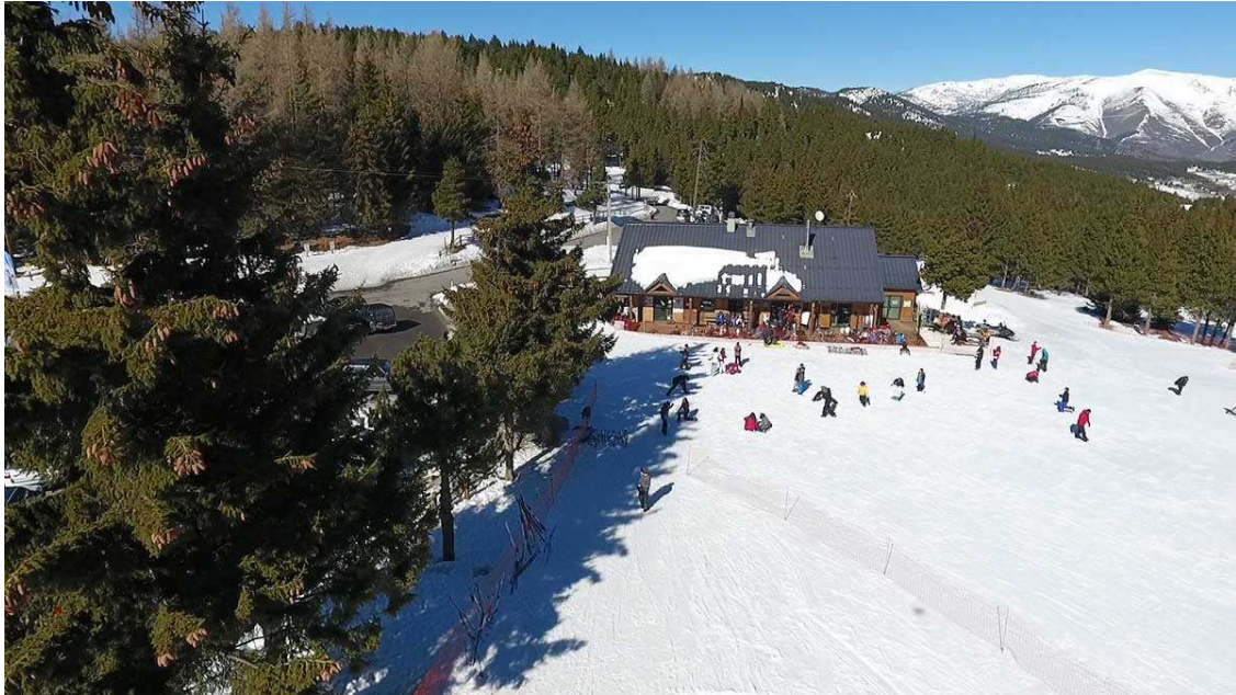
Refugio Col de la Llosa