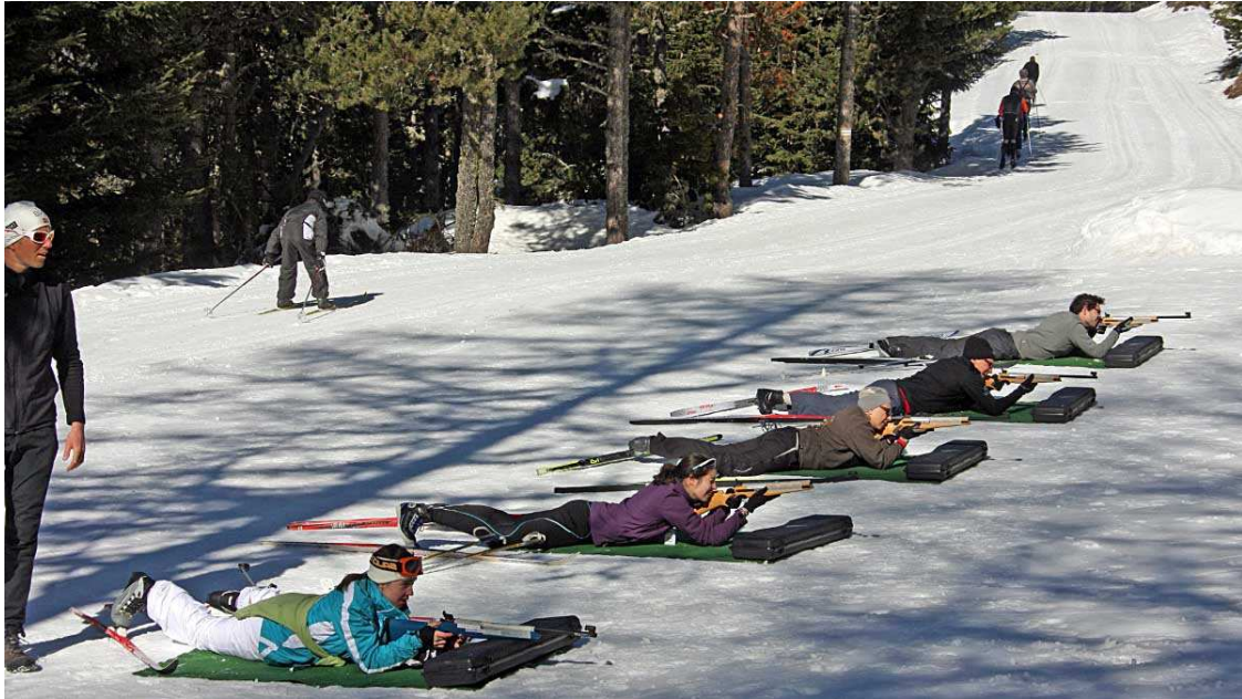
Iniciarse en el biatlón