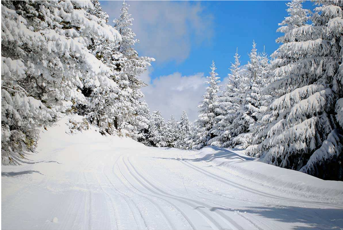
Pistas marcadas en medio de la nevada