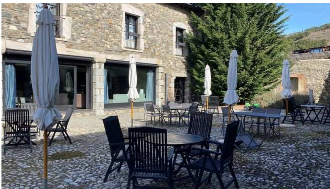
Un hotel de la Cerdanya, preparat per a la temporada (ACN)

"L'increment dels costos de l'energia i la llum ha fet que tanquem portes durant la setmana, quan hi ha menys ocupació, o reduïm serveis. Tot i que hem apujat una mica les tarifes, no podem repercutir el cost als consumidors."