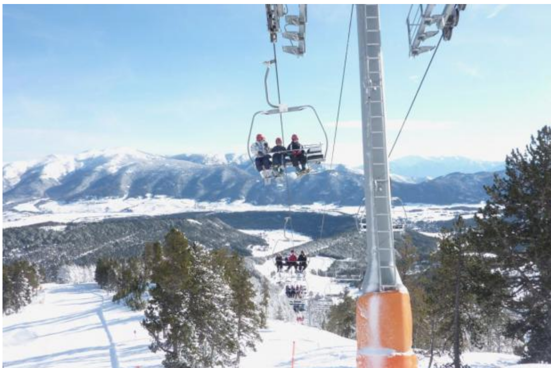
Formiguères en plena temporada.

La estación de esquí de Formiguères dio a conocer las novedades para la temporada 2022-23 en la presentación de Les Neiges Catalanes celebrada este mes de noviembre en Barcelona.