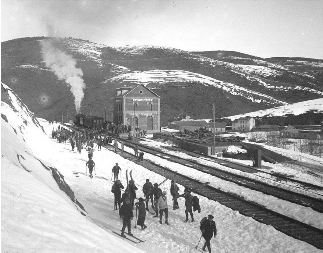
La llegada del tren a la Cerdanya impulsa la popularidad del esquí en la Cerdanya.