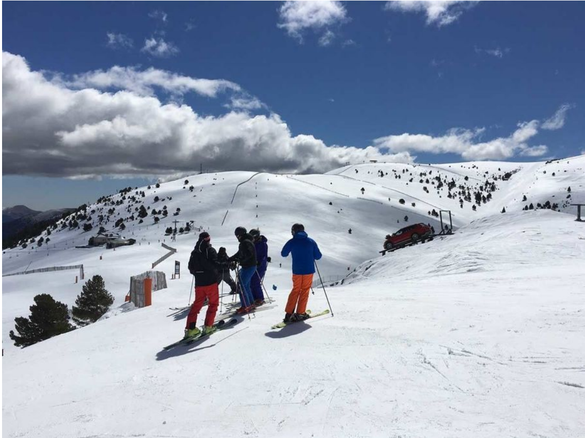
Esquiadores en La Molina.

3 • Font Romeu Pyrénées2000 se sitúa a 21,5 km y 30 minutos (entrada por Les Airelles. Se pueden rebajar los km tomando la telecabina. Entonces serían 18 km y 24 minutos). Km en pistas: 43 kilómetros y cotas 1.700 a 2.210