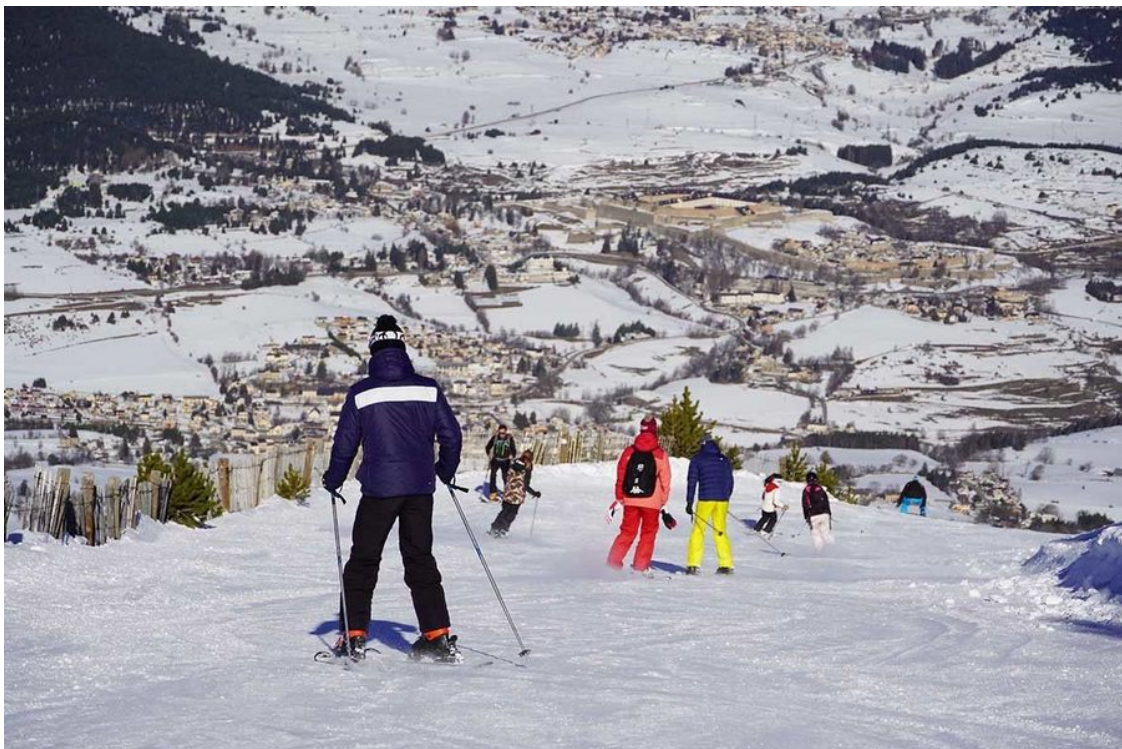
Esquiadores en Cambre d'Aze.

6 • Espace Cambre d'Aze se sitúa a 21,6 km y 28 minutos (entrada por Eyne). Km en pistas: 22 kilómetros y cotas 1.640 a 2.400