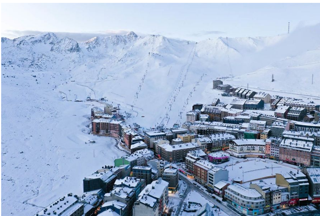
El Pas de la Casa a vista de dron.

8 • Pas de la Casa-Grau Roig se sitúa a 35 km (por túnel del Puymorens, de peaje) y 44 minutos. (Grandvalira) Km en pistas: 200.