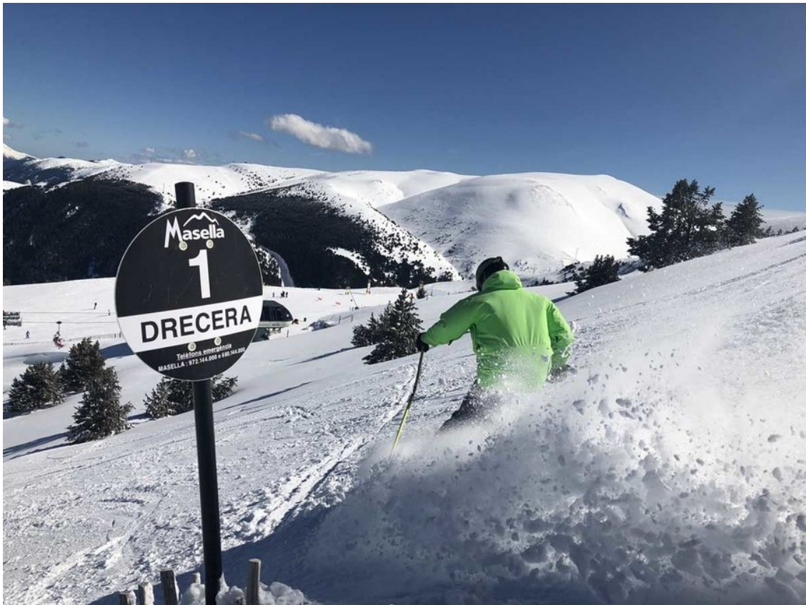
Entrando a la pista Drecera de Masella.

1 • Masella se sitúa a 16,5 km (por Das) y 21 minutos. Km en pistas: 74 kilómetros y cotas de 1.600 a 2500.