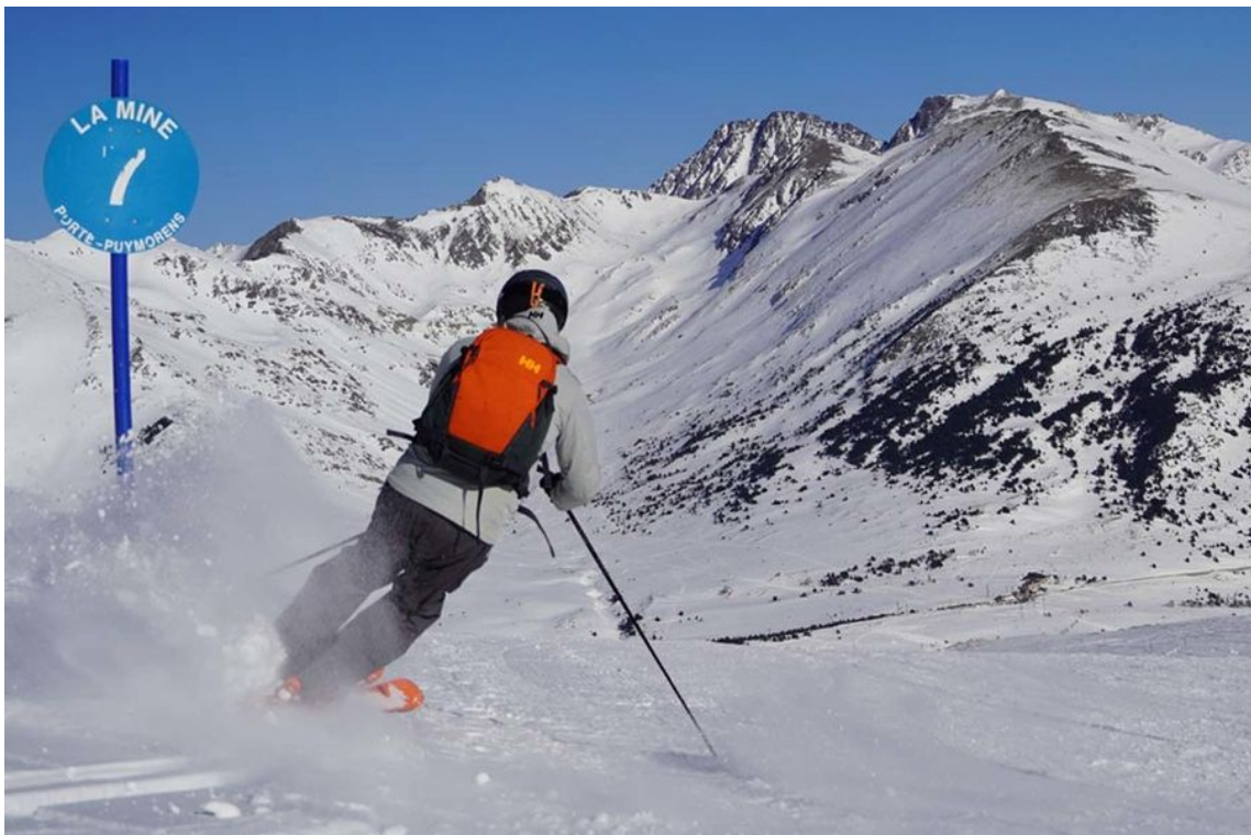
Esquiando por el sector La Mine en Portè (Foto: IST).

4 • Portè Puymorens se situa a 19,7 km y 26 minutos. Km en pistas: 45 kilómetros y 1.600 a 2.500