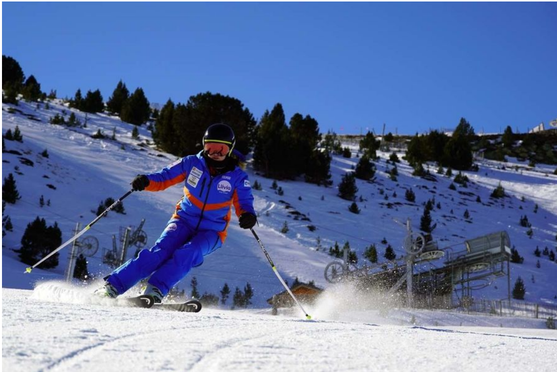
Esquiando en Puigmal 2900 por la pista azul Duraneu (Foto: IST).

5 • Puigmal 2900 se sitúa a 21 km y 28 minutos. Km en pistas: 20 kilómetros y 1.800 a 2.700