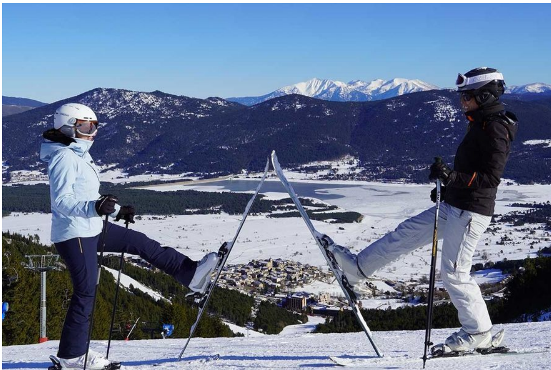
Les Angles y el macizo del Canigó al fondo.

7 • Les Angles se sitúa a 35 km y 45 minutos de coche. Km en pistas: 55 kilómetros y cotas de 1.600 a 2.400