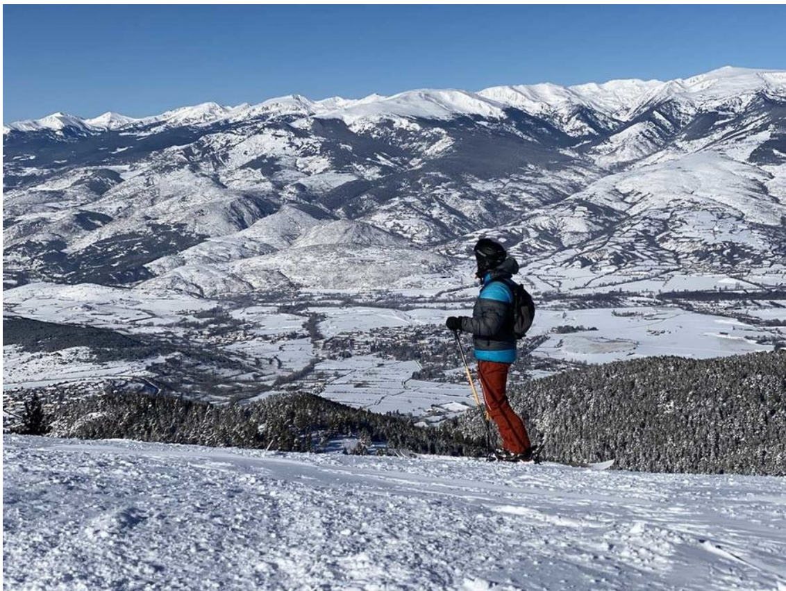
La Cerdanya bien nevada.

Lo confirman, también, las competiciones de nivel internacional que durante estos años han recalado en la zona, prueba que la nieve en la zona, aunque que quizás no es tan abundante como en otras cordilleras o zonas de los mismos Pirineos, debe su calidad precisamente a un clima y ambiente seco.