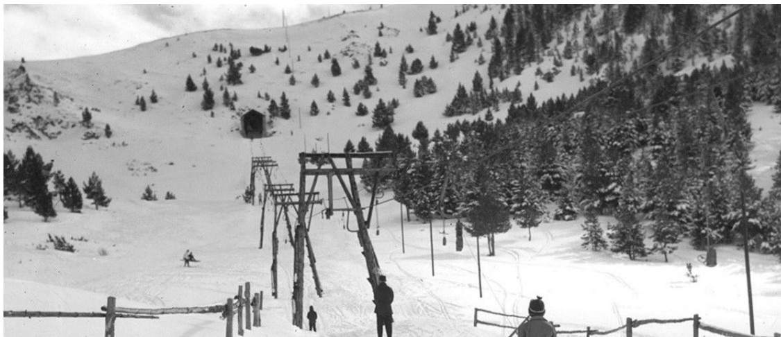
El primer telesquí de La Molina instalado en el año 1943 en la zona de Font Canaleta.

La Cerdanya y su capital Puigcerdà se sitúan en el centro de hasta 10 estaciones de esquí alpino y 5 de esquí nórdico. La más cercana a 20 minutos y 17 km. La más lejana a 44 km y 52 minutos.