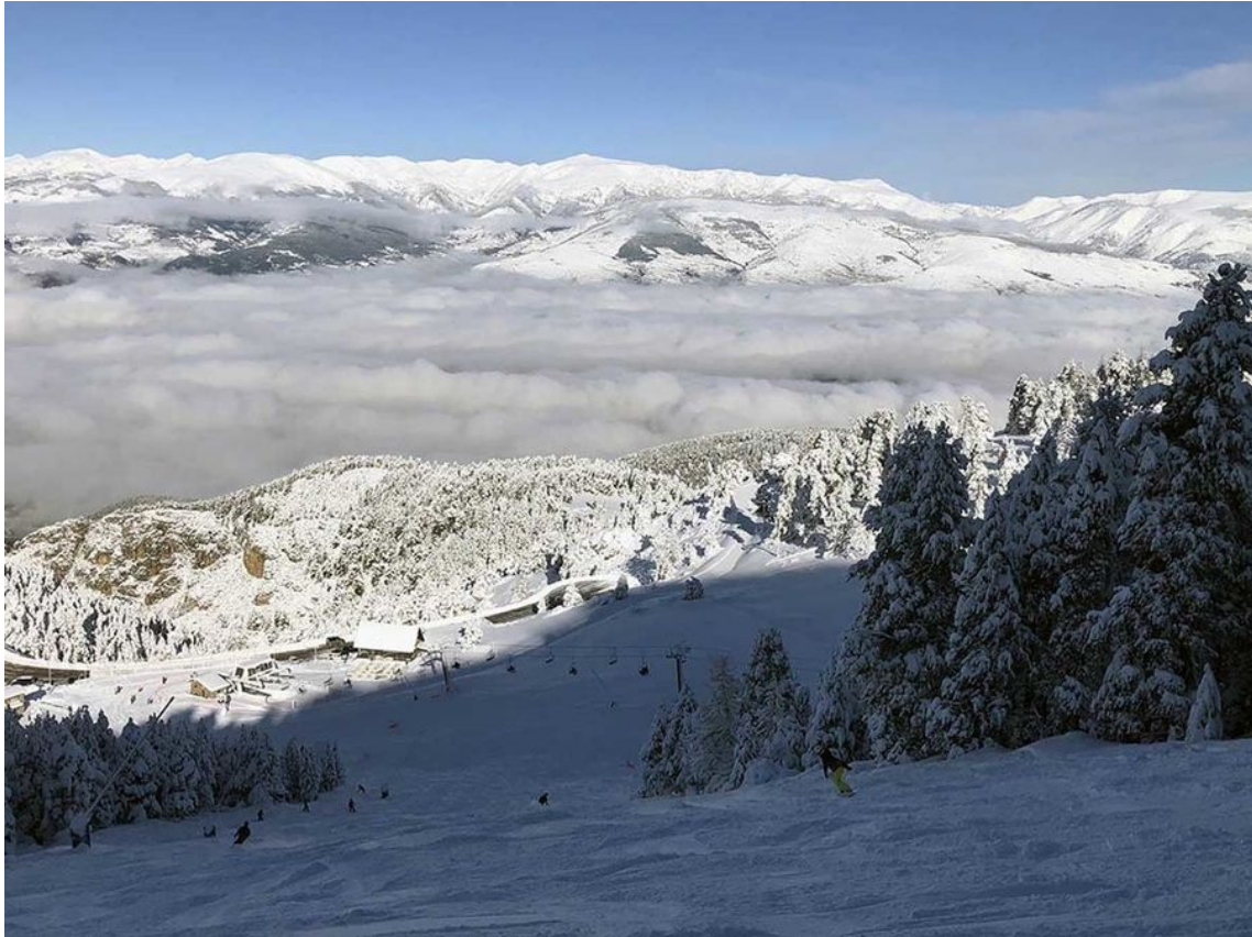
Vista de la Cerdanya nevada desde Coma Oriola de Masella.

Tan solo unos años más tarde, en 1913, se inauguraba en Font Romeu (Alta Cerdanya o Cerdaña administrativamente francesa) el famoso Grand Hotel y, un año más tarde, llegaba allí el tren. Con las dos infraestructuras llegan los primeros turistas a “jugar” con la nieve. Hubo que esperar hasta la siguiente década, en concreto al año 1922, para proyectar la Cerdanya como un destino más que incipiente para los deportes de invierno. La zona de esquí La Molina ganaba popularidad rápidamente con la llegada del tren justo en ese año.