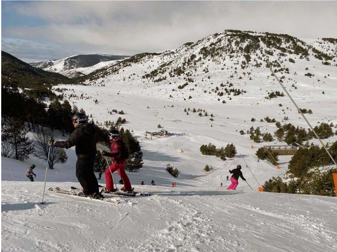
Pista Pradeilles en la cara norte de Font Romeu.

4 • Portè Puymorens se situa a 19,7 km y 26 minutos. Km en pistas: 45 kilómetros y 1.600 a 2.500