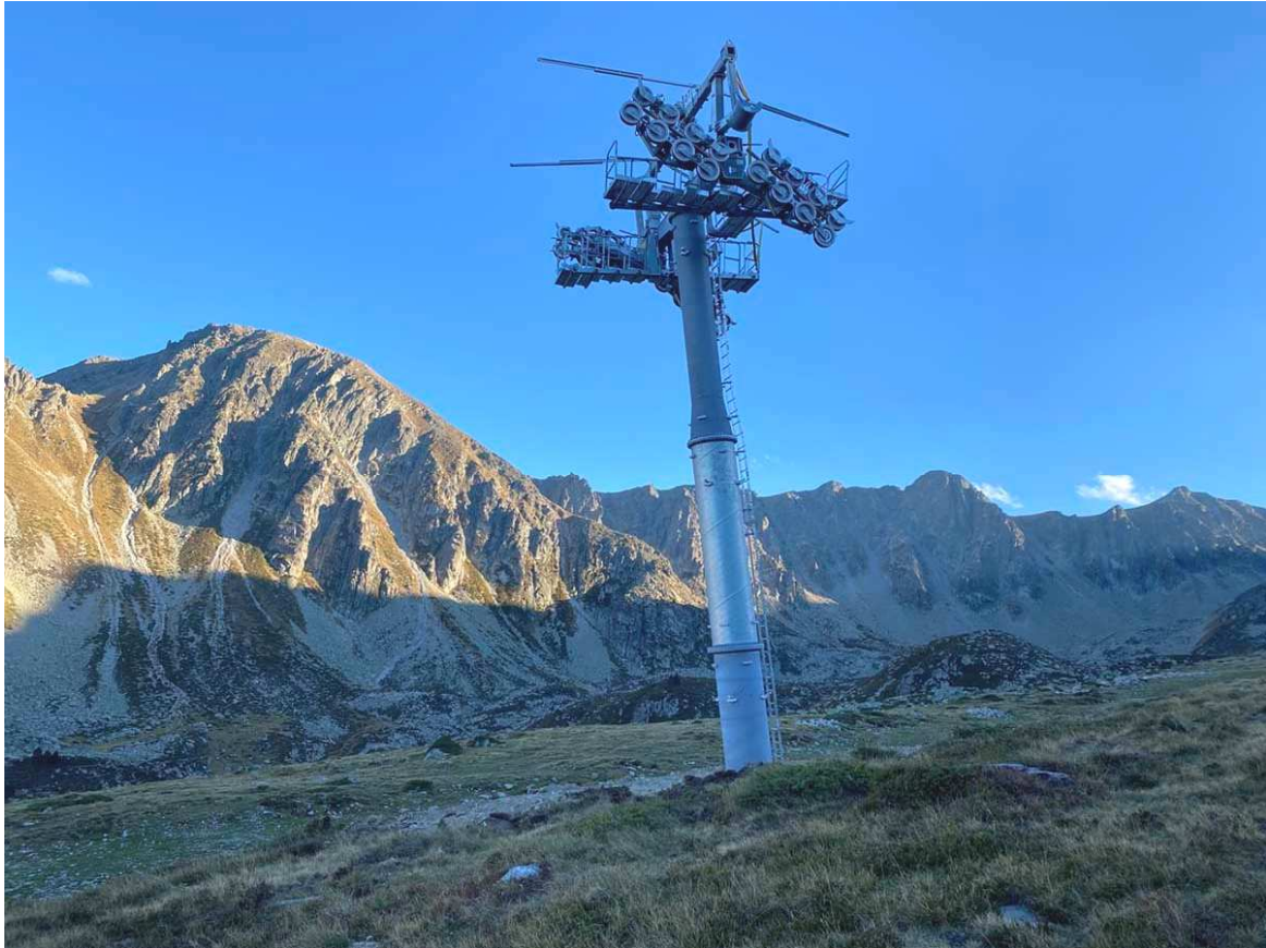
Nuevo telesilla desembragable de 6 plazas Dôme de la Mine