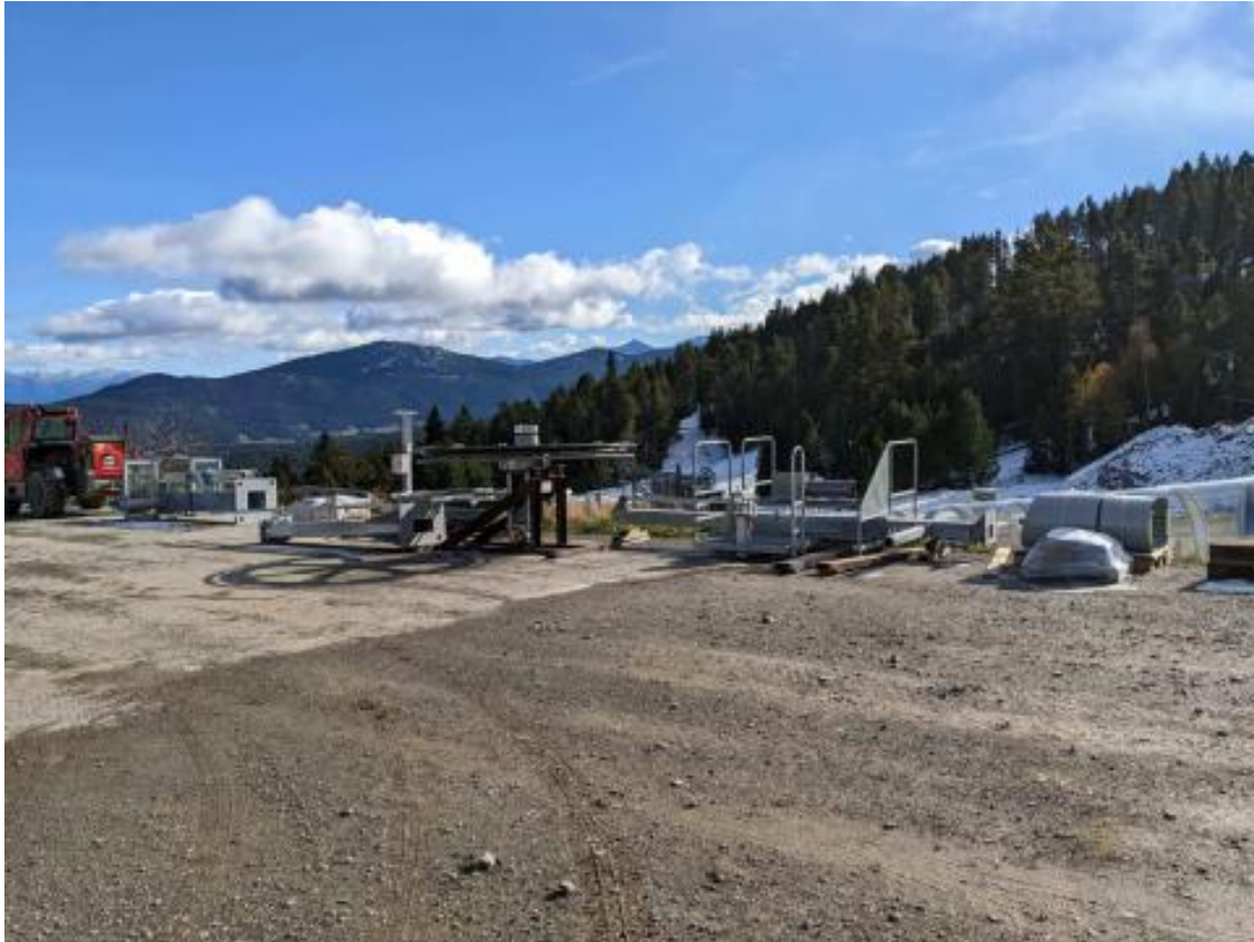
Las estaciones de Trio Pyrénées estrenan mapas 3D, nuevos remontes y pistas. Ver