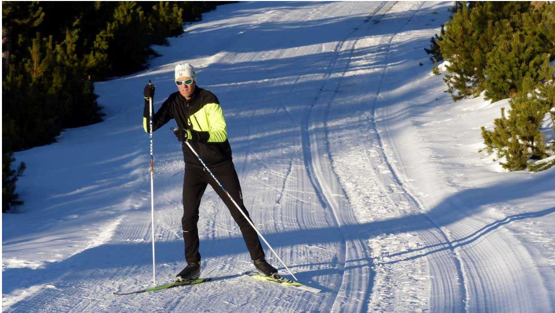
Esquí nòrdic estil patinador (Foto: estació de Nòrdic del Capcir).

L'Estació Nòrdica del Capcir, creada l'any 1982, ha anat creixent en extensió i en activitats al llarg d'aquests 40 anys. A les activitats tradicionals com l'esquí nòrdic clàssic (dos raïls) o l'estil patinador, s'hi han afegit les raquetes de neu, la marxa nòrdica, els trineus arrossegats per gossos, el biatló, el fat bike o l'skijoëring (hípica o canina). Aquestes i altres menys conegudes, però que també es realitzen sobre la neu, tenen el seu punt de trobada a l'estació del Capcir.