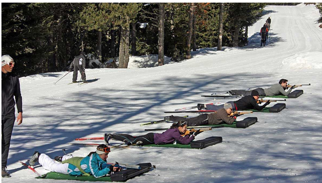
Practicant el biatló.

En definitiva, aquest any l'estació de nòrdic del Capcir es vol posicionar com un espai ideal per als qui busquen natura, neu, paisatges poc coneguts i espectaculars i en els quals practicar activitats físiques en un entorn sense massificacions i on només es respira l'ambient de la neu i l'alta muntanya. Els 40 anys són, doncs, una bona oportunitat per conèixer aquest espai del Pirineu de la Catalunya del Nord. Us hi animeu?