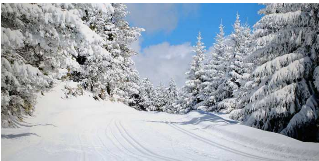
L'Estació de Nòrdic del Capcir es prepara per al seu 40 aniversari

Agenda carregada d'activitats i esdeveniments per a celebrar els seus 40 anys