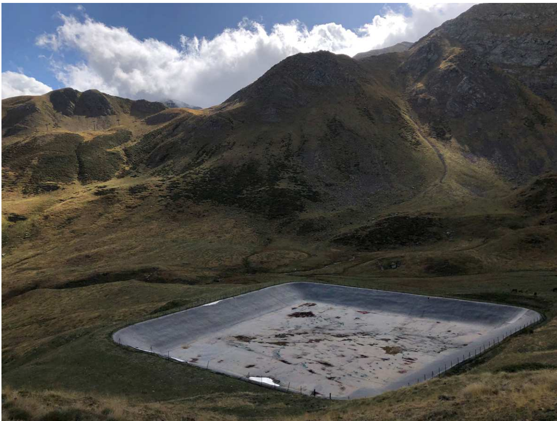
Llac en construcció per a l'emmagatzematge d'aigua destinada a la producció de neu.

S'obliden escriure en els seus tuits que, a diferència de la que es fa servir en els regadius agrícoles o a les embotelladores d'aigua mineral que esmento unes línies més amunt, la dels canons prové d'un cicle gairebé tancat. És aigua que es queda aquí. O sigui: es fa servir aigua de la neu fosa a la passada primavera, emmagatzemada als llacs a l'espera de fer-ne ús de nou a l'hivern. Tot i que hi ha qui els ho ha recordat, ja no els interessa corregir-ho.