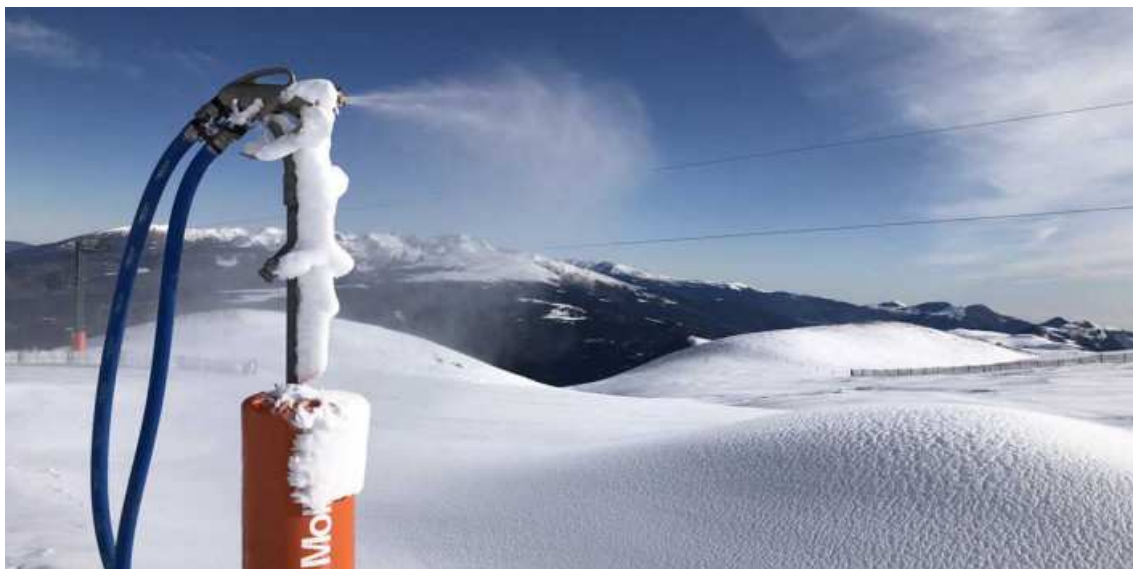
Canó de neu a La Molina. Imatge d'arxiu.

Ens trobem a pocs dies de començar la temporada d'esquí. Potser hores o minuts quan es publiqui aquest article. Quan encara estem recordant les temperatures anormalment altes d'aquest passat estiu, i patint la sequera que continua accentuant-se en molts racons del país, els qui vivim amb passió els esports d'hivern comencem a estar en el punt de mira d'alguns... experts en els motius de les sequeres.