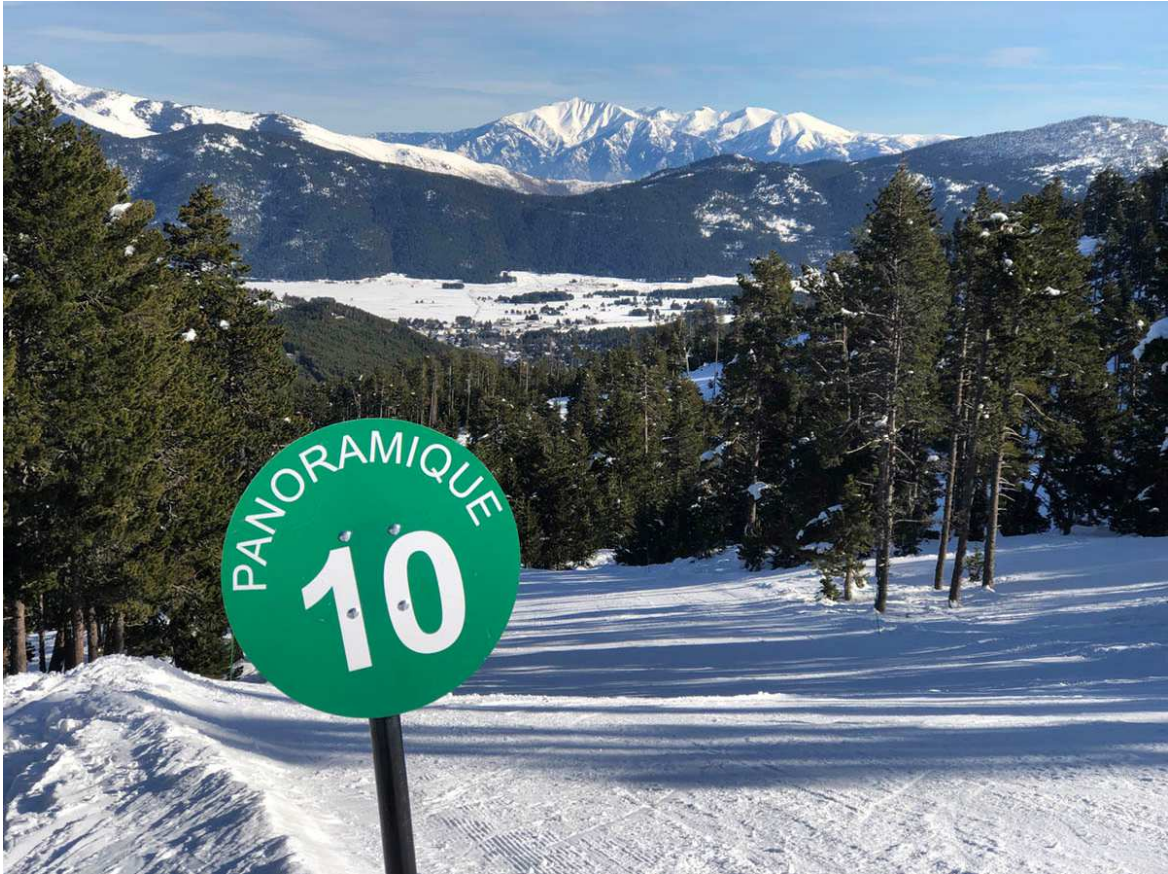
La pista Panoràmica ha estat remodelada en la seu ram superior. Al fons, el massís del Canigó.

Formiguères enguany també presenta algunes novetats i millores que són, només, un aperitiu de què vindrà en els anys vinents. L'estació s'integra dins la societat Trio-Pyrénées , fet que li permetrà una injecció econòmica de prop de 10 milions d'euros, una xifra prou important per modernitzar instal·lacions i serveis.