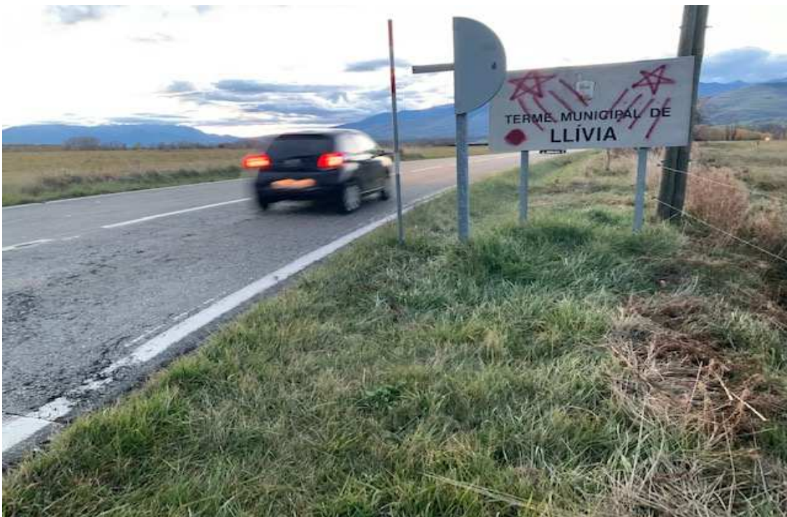
Entrada al terme municipal de Llívia des de Ro.

Entre altres iniciatives, s'ubicarà una exposició permanent dedicada a la frontera a l'emblemàtica torre Bernat de So