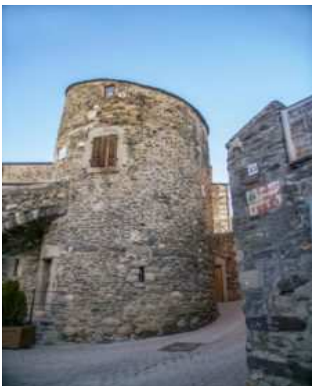
La torre Bernat de So de Llivia.

La idea, en el seu conjunt, han apuntat des del museu, "és aconseguir que la visita a l'espai sigui una experiència immersiva, interactiva i dinàmica, des de bon inici".