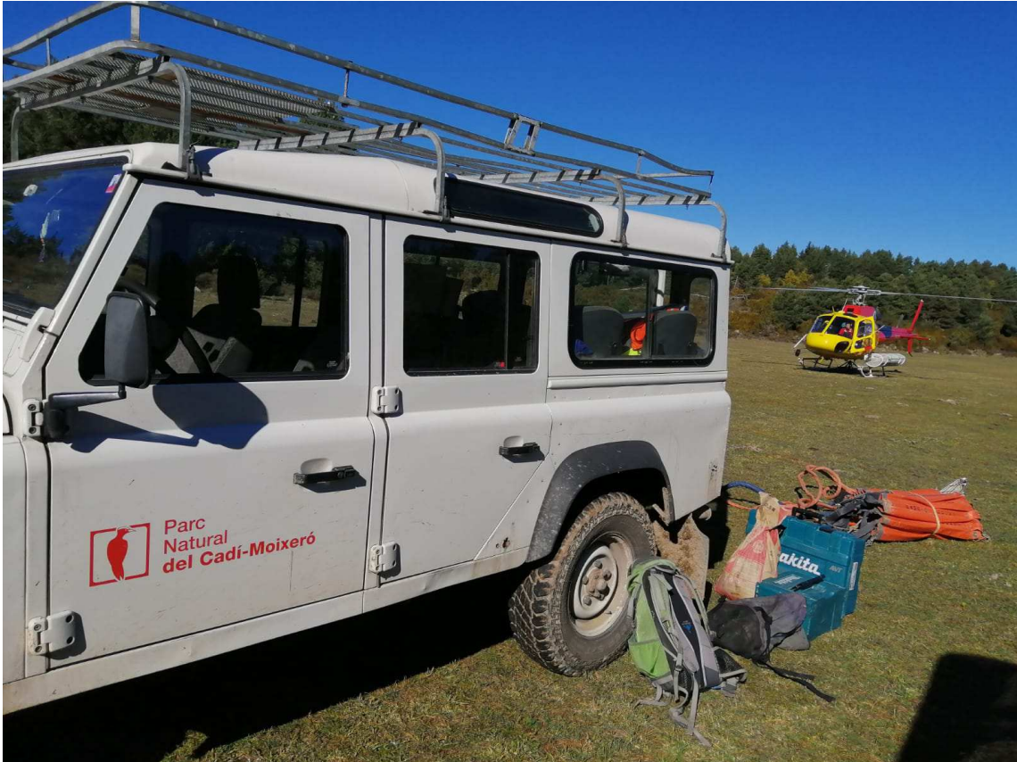
El Parc Natural del Cadí-Moixeró ha instal·lat un suport metàl·lic com ancoratge de seguretat a la carena de la Canal del Cristall

Aquest pal de fusta, segons el PNCM no reuneix les condicions mínimes de seguretat per aquesta funció, ja que no es va instal·lar pensant que pogués servir per aquest ús.