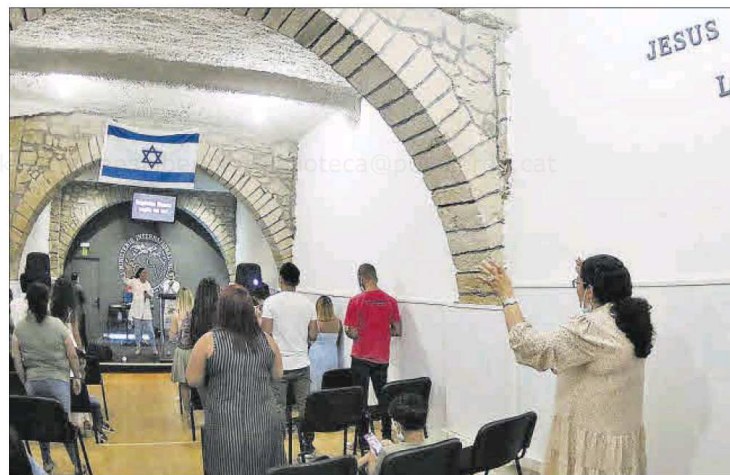
Celebració d'una cerimònia religiosa en una església evangèlica de la capital del Bages