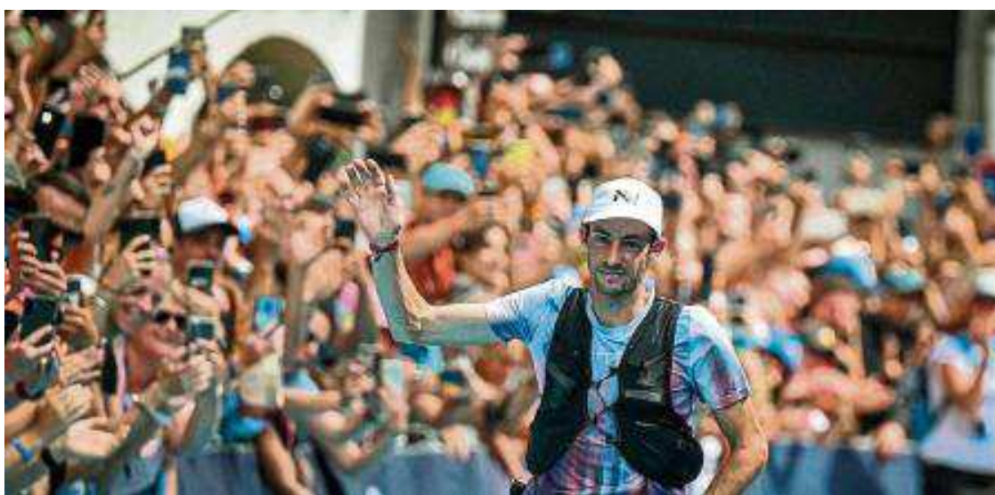
Kilian Jornet, en la meta de Chamonix.

El catalán critica al Consejo Olímpico de Asia y al COI por escoger contra natura el territorio saudí, que organizará el evento continental en 2029