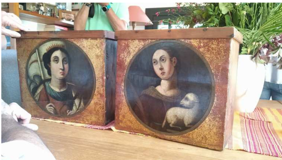
Mobiliari de la farmàcia Esteva de Llívia

El treball, encarregat pel Museu de Llívia, ha estat elaborat per l'Institut Català de Recerca en Patrimoni Cultural