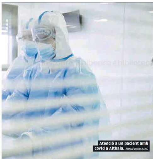
Atenció a un pacient amb covid a Althaia.