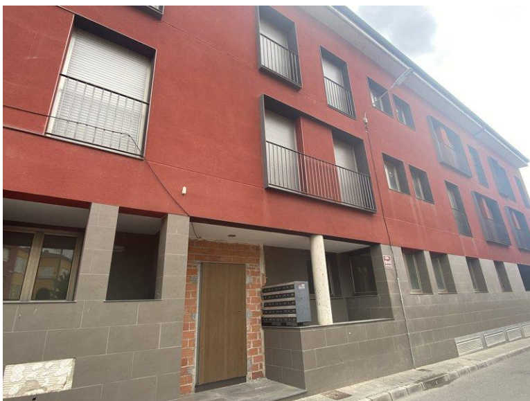
L'edifici ocupat dijous passat a Caldes Malavella CEDIDA .