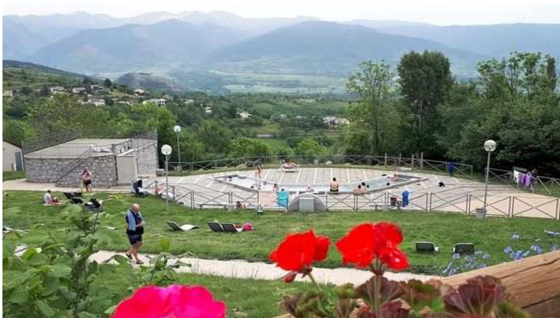
Banys de Dorres, a la Cerdanya (CAT de Setmana)

De seguida, però, comencem el descens i anem girant cap a llevant per un tram enclotat que ens connecta amb el rec de Joell. Aquest és un tram d'aigua i bosc de ribera molt agradable, que ens enllaça amb el punt de trobada, al trencant del tram empedrat.