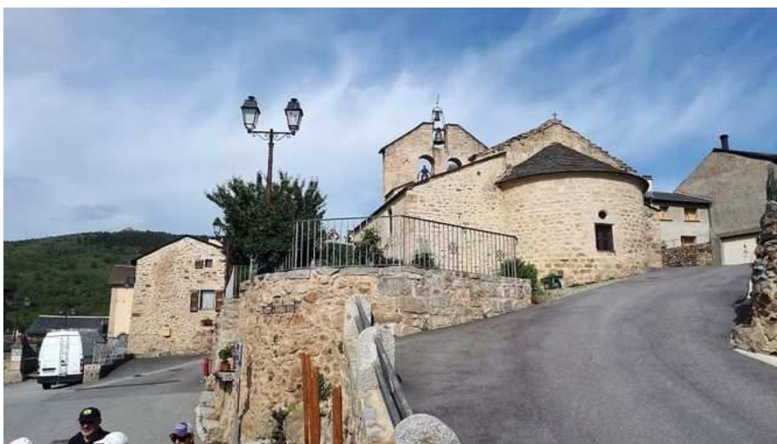
Centre de Dorres, a la Cerdanya (CAT de Setmana)

Aquesta proposta de ruta per la Catalunya Nord és fàcil. Som a la Cerdanya, al Pirineu, però tranquils: no es tracta de pujar cap cim entre tarteres ni res d'això. Ens arribem fins a l'església romànica de Bell-lloc (1.700 metres) des del poble de Dorres. El desnivell és d'uns 250 metres i la ruta circular és de poc més de cinc quilòmetres.