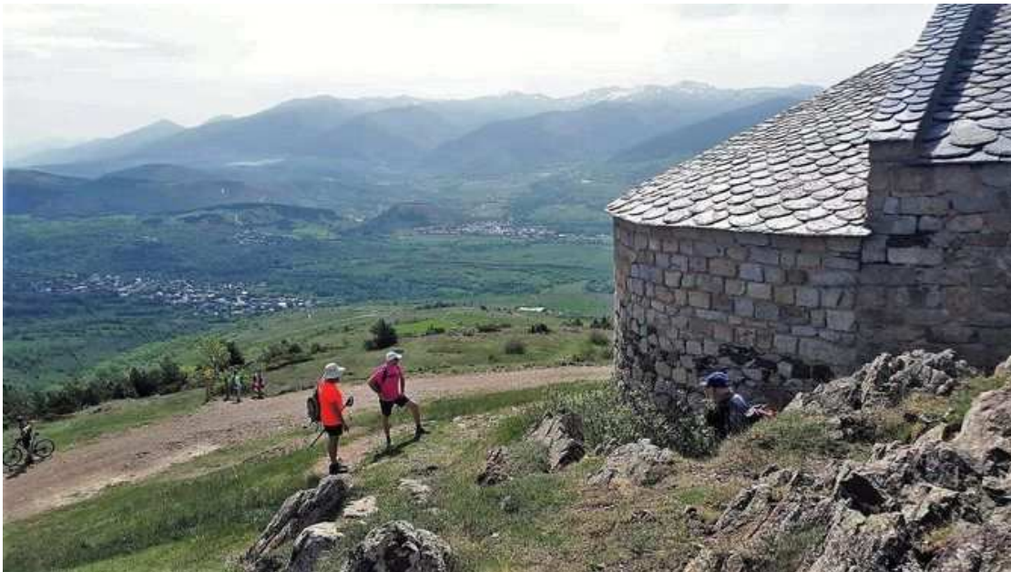
Vistes des de la part posterior de Bell-lloc (CAT de Setmana)

El camí, ara sí, es va enfilant: primer entre arbres, però després entre prats i pastures. De seguida veiem l'església, que queda sobre nostre, dalt d'un turonet. Un cop a dalt, hi descobrim una nau ben conservada i algunes construccions de l'entorn menys afortunades. I unes bones vistes, això sí.