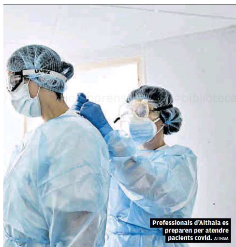
Professionals d'Althala es preparen per atendre pacients covid.

que aquest setembre arribaran 10 milions de dosis de vacunes contra la covid adaptades a la variant òmicron. L'objectiu és que s'utilitzin per a la segona dosi de reforç. L'òmicron, i sobretot l'anomenada BA.5, és la més comuna i també la que s'encomana més fàcilment, segons les mostres que s'han analitzat a la Catalunya central.