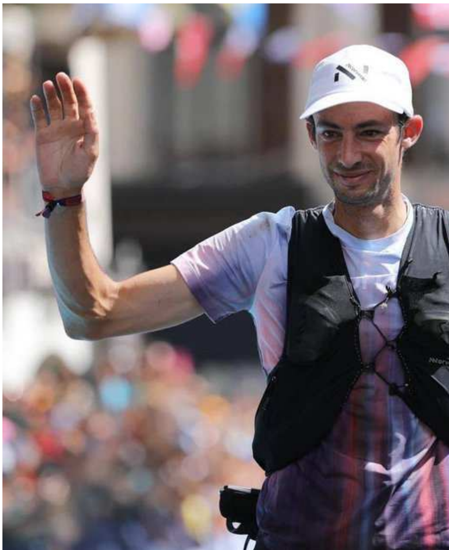
Kilian Jornet, en l'arribada a la ja mítica plaça del Triangle de l'Amistat @