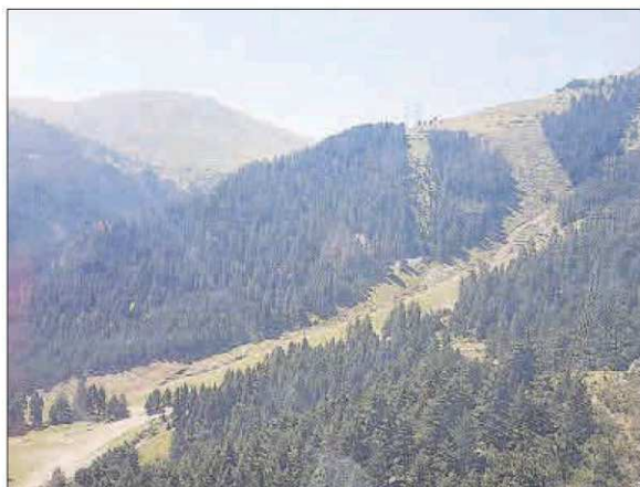
Una vista actual dels treballs a la pista Barcelona