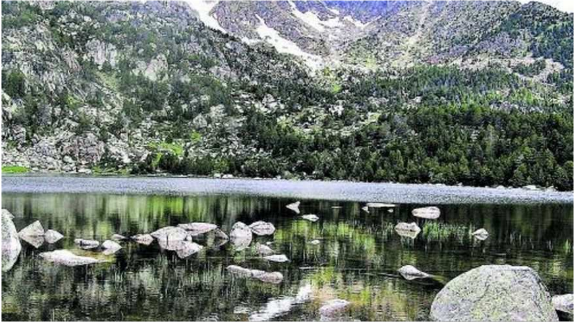
Una imatge del paratge de l'estany de Malniu.

Un dels itineraris que podem proposar primer és el que està recollit a la web Cerdanya.org on es detalla de manera molt precisa les principals característiques de la caminada que haurem de superar. Primer de tot hauríem de fer parada al seu reconegut refugi. La dificultat és pràcticament mínima i el recorregut es pot superar en una hora. Es pot arribar al refugi des de Meranges seguint sempre la pista forestal que hi va i també s'hi pot accedir des de l'estació d'esquí nòrdic de Guils Fontanera seguint la pista que continua pel Pla de la Feixa i baixa després fins al refugi, segons se'ns explica a la web ceretana. Es tracta d'una bona caminada per anar habituant-nos a la zona i arribar després amb una altra caminada fins a la zona de l'estany. La culminació seria l'estany de Malniu, situat a 2.250 metres d'altura.