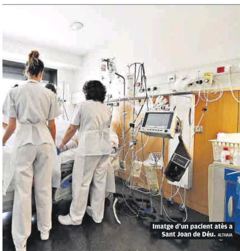
Imatge d'un pacient atès a Sant Joan de Déu.

A Sant Andreu Salut, ahir hi havia 14 persones ingressades amb covid-19. El dimarts anterior, 2 d'agost, hi havia 10 persones ingressades a la Unitat d'Aïllament per Covid-19 de l'Hospital de Sant Andreu. Durant la darrera setmana 9 persones han ingressat, 5 persones han estat donades d'alta i no s'ha hagut de lamentar cap víctima mortal després de tres setmanes consecutives amb decessos. D'aquesta