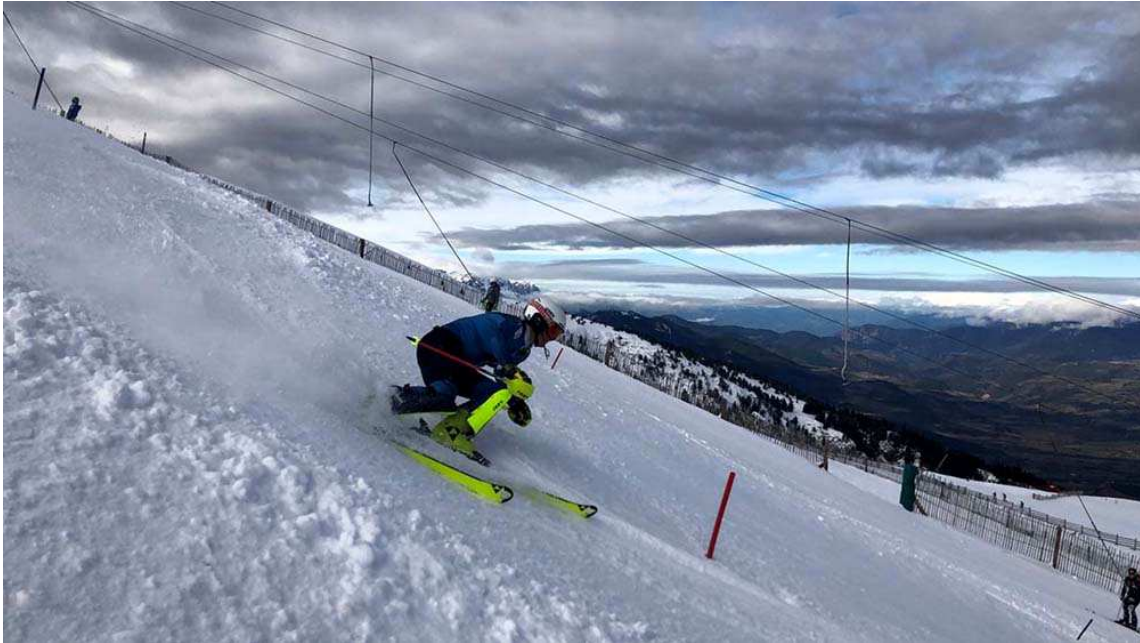
Esquiadors de la FCEH entrenant a les pistes del sector Tosa de Masella