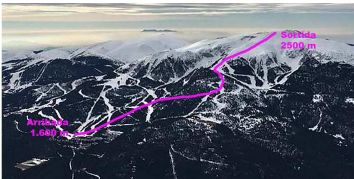
Simulació aproximada del traçat de la pista de descens projectada a Masella Autor/a: Adaptació

El nou traçat permetria acollir proves de descens i supergegant