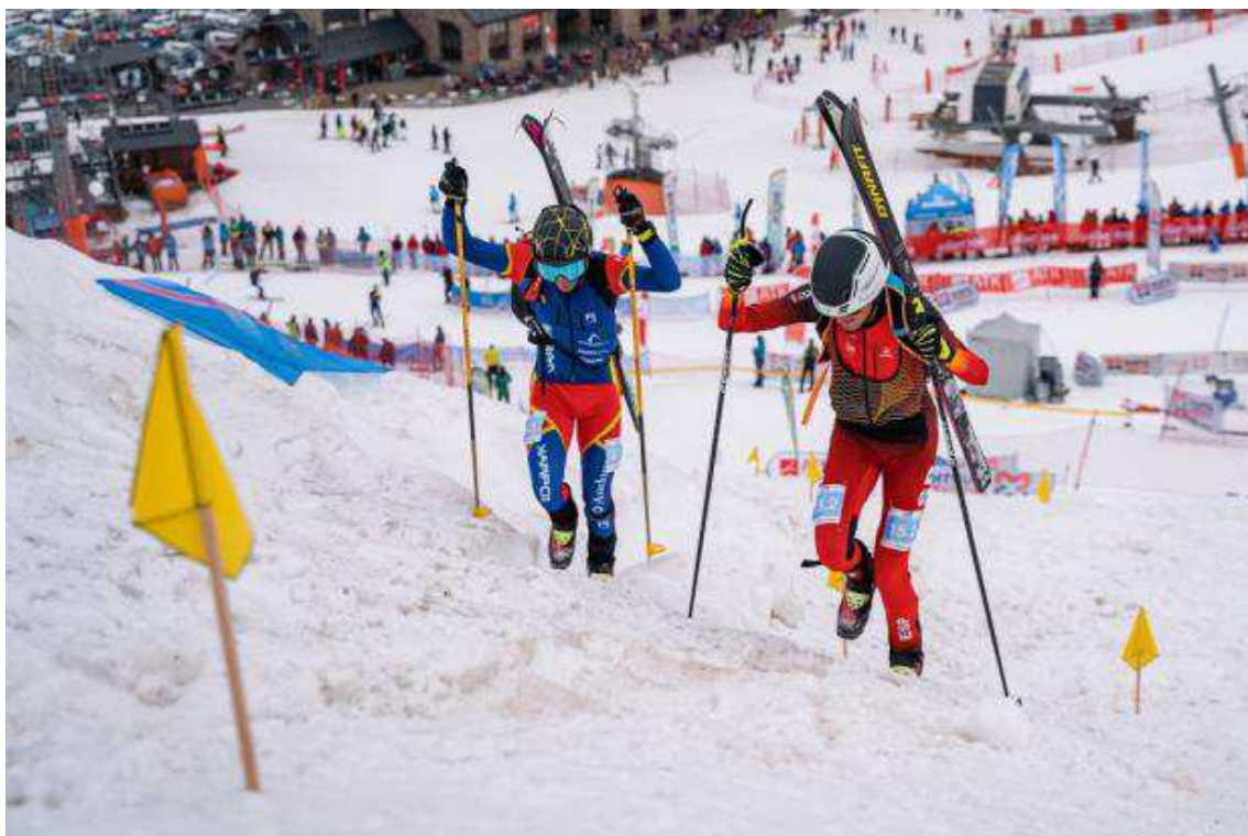
Foto Campeonatos de Europa de Skimo Boí Taüll 2022

La propuesta catalana no concreta si es para los Juegos de 2030 o 2034, pero sí presenta las alternativas a las sedes previstas en Aragón.