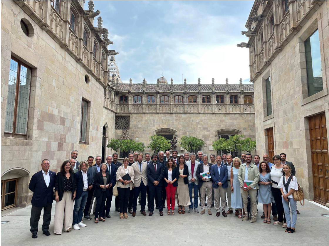
Foto de familia de los asistentes a la reunión.

El proyecto ya está colgado en la web govern.cat para que todo el mundo pueda consultarla y la Generalitat ya la ha hecho llegar al Comité Olímpico Español (COE), que a su vez debe decidir si la traslada al Comité Olímpico Internacional (COI).