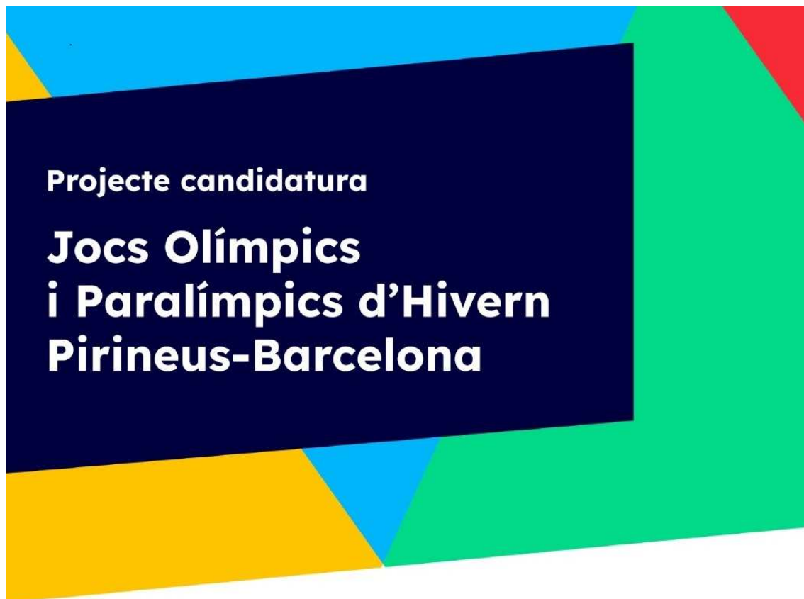
Portada del proyecto de candidatura de los Juegos de Invierno