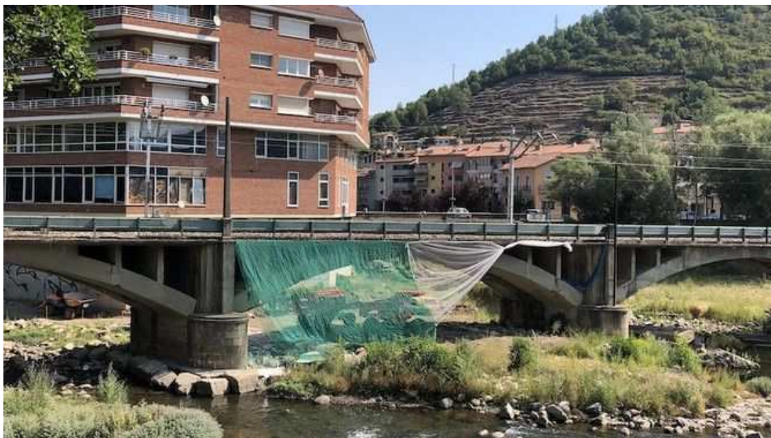
Les obres al pont de Ripoll costaran més d'un milió d'euros (Ajuntament de Ripoll)

Segons aforaments d'anys pre-pandèmia, es preveu que transbordin a Ripoll una mitjana diària de 1.300 usuaris , tenint en compte que els fluxos i l'afluència canvien molt depenent de si són de dilluns a dijous, divendres, dissabtes o diumenges.