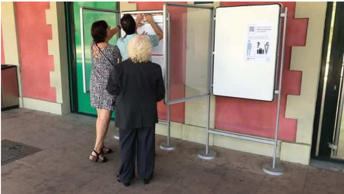
Un operari de Renfe posa els nous horaris, a l'exterior de l'estació de Ripoll

El servei entre Ripoll i l'Hospitalet de Llobregat, o a la inversa, es farà amb els trens i horaris habituals.